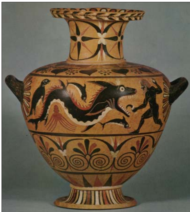
Fig. 6 : hydrie, coll. Niarchos, Paris [d'après Greek Vases from the Hirshmann Coll. (1982) n° 10]

Pour les archéologues contemporains, le kétos est le monstre par excellence. Pourtant, son nom, qui donnera cetus en latin et cétacé en français, désigne n'importe quelle grosse bête aquatique, baleine, dauphin ou même thon. Homère appelle « kétos » aussi bien les phoques du dieu marin Protée, que les compagnons bondissant de Poséidon, l'animal qui menace de dévorer Ulysse naufragé ou l'une des proies de Skylla .