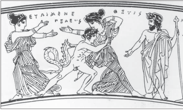
Fig. 7 : épinétron d'Érétrie, Athènes, M.N. 1629 [d'après J. Boardman dans Monsters and Demons in the Ancient and Medieval Worlds (1987) pl. XXIII fig. 6]

curiosités, volontiers déposées dans des sanctuaires. Les temples aimaient posséder des «reliques» qui attiraient le pèlerin et les restes d'animaux mythiques étaient très populaires : on montrait les défenses du sanglier de Calydon en différents endroits et un édile romain, M. Scaurus, avait rapporté de Jaffa à Rome le squelette du monstre qui avait menacé Andromède.