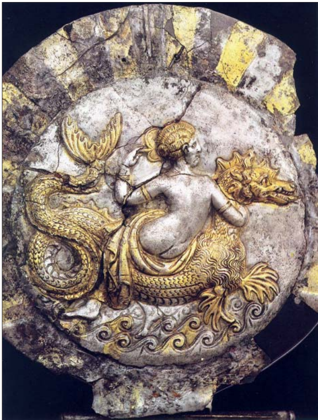
Fig. 8 : coffret en argent doré, Tarente, M.N. 22. 429-22.430, [d'après Les ors hellénistiques de Tarente, cat. expo. Paris (1986) n°8 ]

des poses langoureuses. Désormais dévêtues, leur carnation claire permet de jolis contrastes avec les couleurs sombres des monstres. De nouveaux monstres tels que taureaux ou fauves anguipèdes, font leur apparition (Fig. 8).