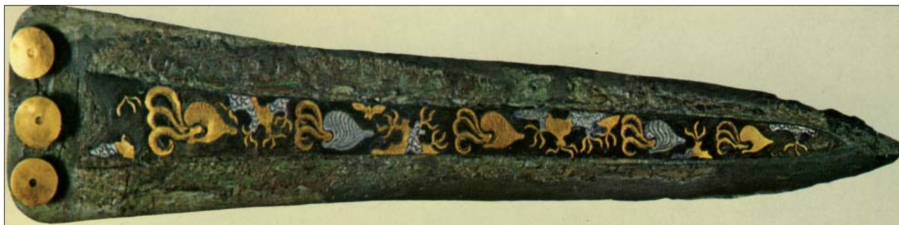
Fig. 2 : poignard de Routsis, Athènes, M.N. 8339 [d'après The Greek Museums (1975) fig. 29]

naturelle parmi des nuages de bulles mais sont en fait traités comme des motifs répétés en alternance qui scandent l'espace fermé, en haut et en bas, par des rochers, des éponges et des éléments végétaux. (Fig. 1)