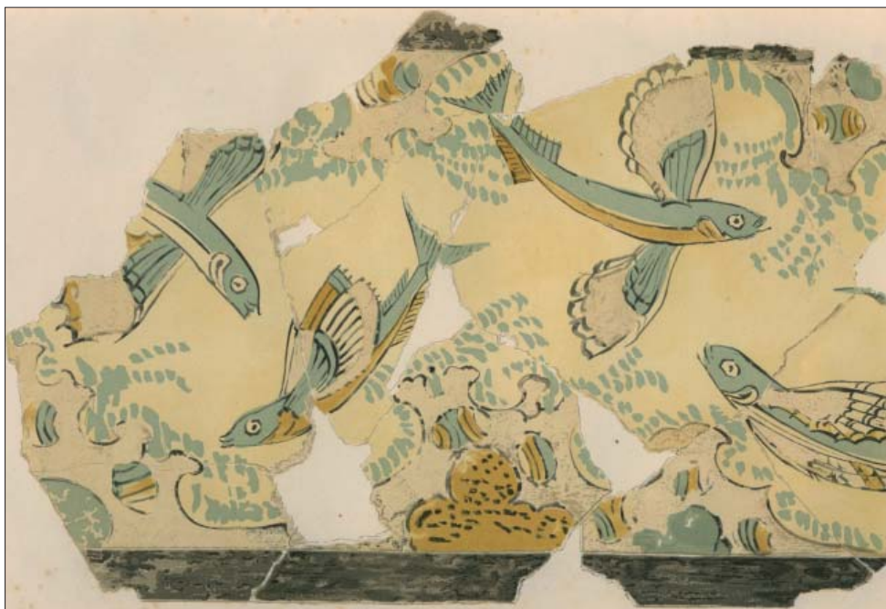
Fig. 1 : peinture de Phylacopi [d'après Excavations at Phylacopi in Melos, JHS suppl. IV (1902) pl. III ]

Ce sont pourtant les animaux qu'on pouvait observer le plus facilement qui ont d'abord été figurés. Du XVI e au XII e s. av. J.-C., des artistes de la Crète minoenne et de Mycènes se sont inspirés de la faune marine, reproduisant différentes sortes de poissons, des dauphins, des poulpes, sans pour autant chercher à en donner une image exacte. Leur but n'était pas de figurer la nature mais de la réinterpréter par le choix des couleurs, par la mise en évidence de certaines parties de l'animal, par la composition même comme le montre une peinture de Phylacopi, à Mélos, décorée de poissons volants. Nous pouvons reconnaître l'espèce, Exocoetus evolvans , pourtant l'artiste a utilisé librement les couleurs pour créer une unité entre les animaux et l'arrière-plan rocheux. Ces poissons aux «ailes» tantôt ouvertes, tantôt fermées semblent évoluer de façon