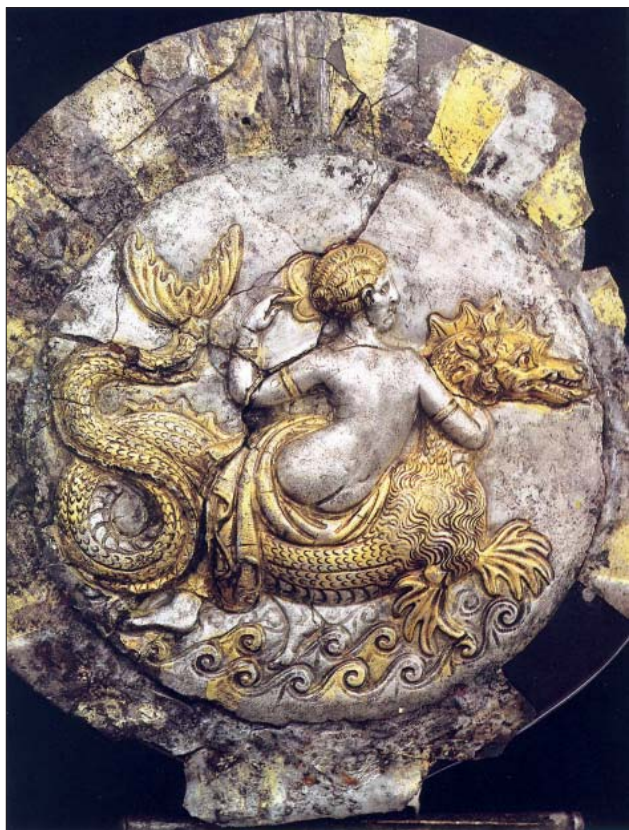
Fig. 8 : coffret en argent doré, Tarente, M.N. 22. 429-22.430, [d'après Les ors hellénistiques de Tarente , cat. expo. Paris (1986) n°8]

des poses langoureuses. Désormais dévêtues, leur carnation claire permet de jolis contrastes avec les couleurs sombres des monstres. De nouveaux monstres tels que taureaux ou fauves anguipèdes, font leur apparition (Fig. 8).