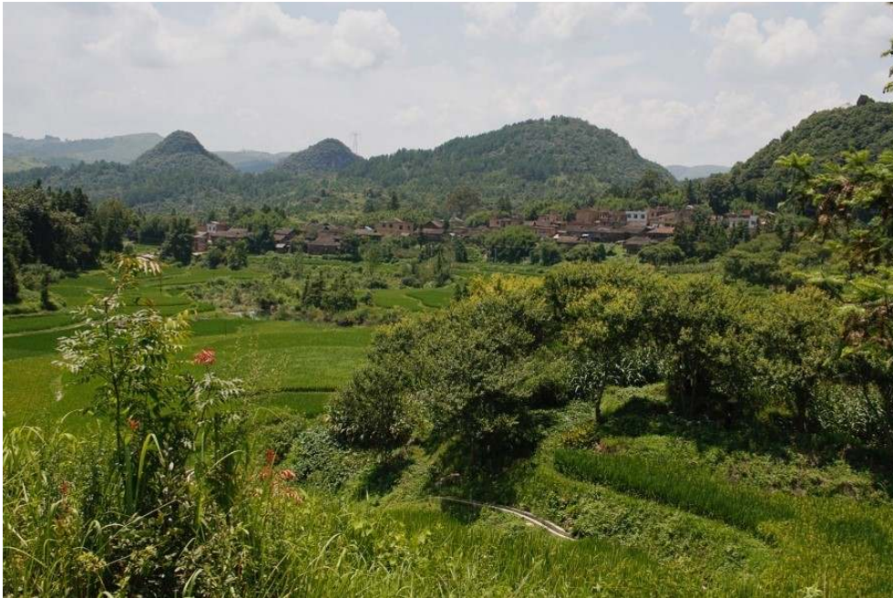
Photo 5. Karst à cônes et village shui de Shuige au Guizhou, Chine