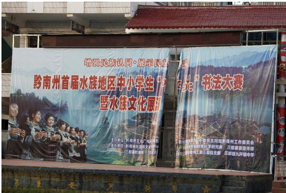
Cliché : É. Gauché, août 2016