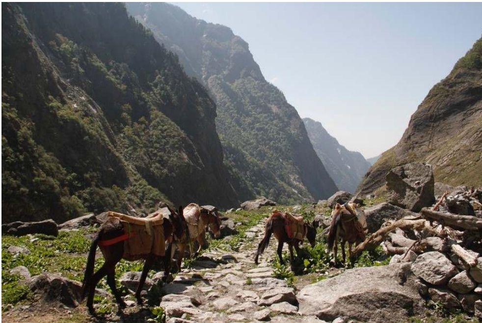
Photo 2. La haute vallée du Johar, Uttarakhand, Inde