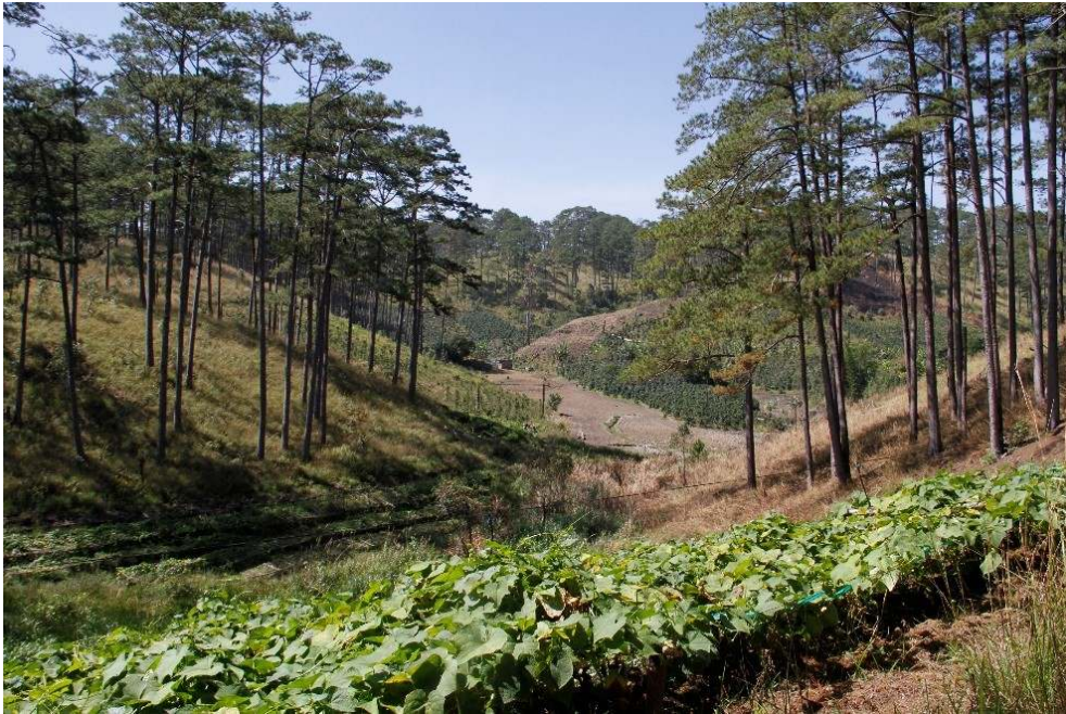
Photo 3. Forêt de pins et petite agriculture en bordure du Parc national de Bidoup NuiBa, Vietnam