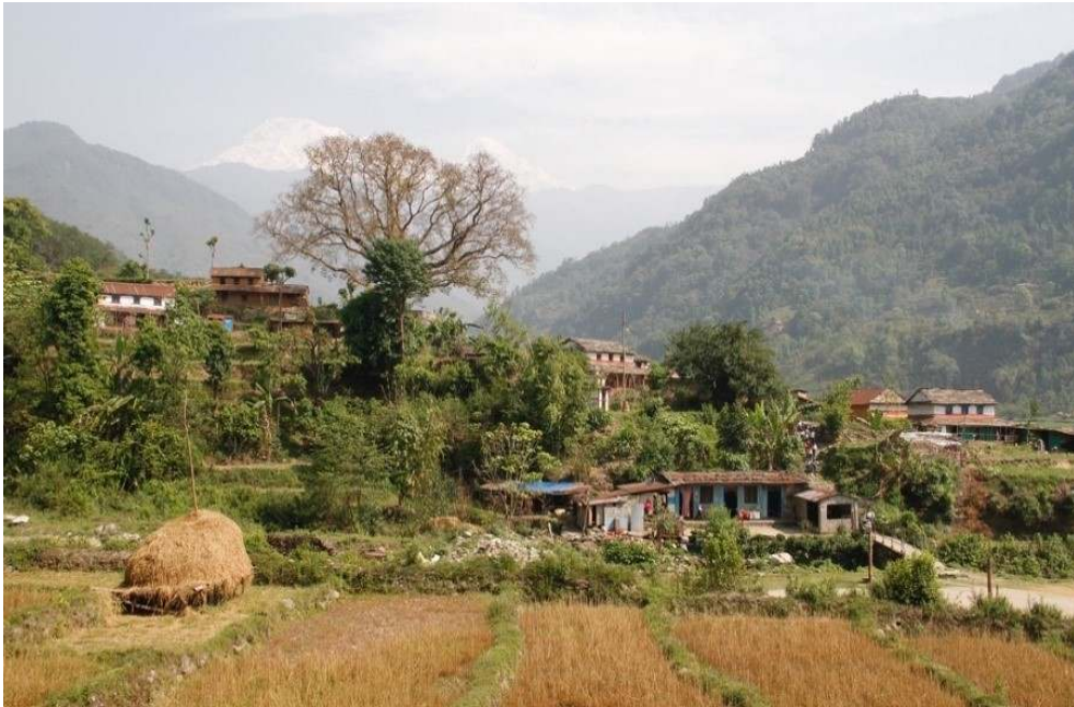
Photo 1. Vallée en versant sud de l'Annapurna (au fond) et village gurung, Népal