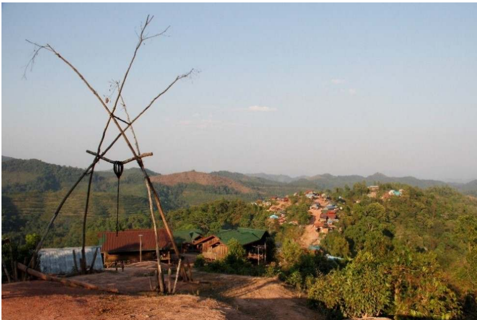
Photo 4. Le village akka de Phuvan, Laos