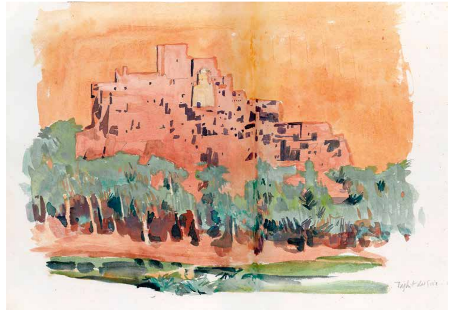
Yvon Le Corre, Taghit, Sahara, grand erg occidental , aquarelle, 1996, 29 x 50 cm.

Drôle de formule, «raison d'être», pour cette chose qu'est l'oasis. C'est que cette chose n'est pas naturelle ou, pour être plus précis, elle est artificielle et d'origine anthropique. Il faut se garder des insidieuses réminiscences de Tintin au pays de l'or noir : une oasis, ce n'est pas trois palmiers et une flaque d'eau. C'est l'association d'une agglomération humaine et d'une zone cultivée – souvent une palmeraie – en milieu désertique. La palmeraie d'une oasis est un espace agricole en polyculture irriguée entièrement créé par la main de l'homme. Très intégrée, la palmeraie typique est structurée verticalement en trois strates : des palmiers dattiers dominent des arbres fruitiers (oranger, bananier, grenadier, pommier, etc.) qui eux-mêmes ombragent des plantes basses maraîchères ou fourragères, ou des céréales. Elle est un puzzle de jardins privés contigus. L'oasis est tout autant intégrée à son environnement désertique (connectée aux circuits de transhumance des pasteurs nomades, branchée sur les routes sahariennes)