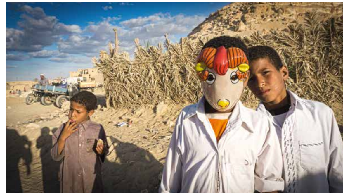
Enfant au masque de bélier lors de la fête annuelle de Siwa, ancienne oasis d'Amon, dont le bélier était l'une des figures, Dakrūr (Égypte, désert libyque), 2015, Vincent Battesti.

Les oasis sont connectées à un réseau d'échanges, et leur écologie même – la majeure partie de leur biodiversité et sans doute l'intégralité de leur agrobiodiversité – est tributaire de ce réseau. Par exemple, dans la vieille oasis antique de Siwa, située dans le désert libyque (aujourd'hui dans le nord-ouest de l'Égypte) à la croisée de vieilles pistes caravanières, la biodiversité du palmier dattier ( Phoenix dactylifera L. ), l'espèce clé de voûte des systèmes oasiens, semble bien être structurée par un projet d'économie d'exportation. Les deux variétés qui y sont très majoritairement cultivées sont complémentaires. La première produit des dattes dites sa'idi , demi-molles, fort appréciées des marchés urbains lointains (très sucrées, elles se conservent sous la forme d'une pâte dite 'agwa , prisée en confiserie). Elles sont transportées par des bédouins qui préfèrent la seconde variété, des dattes dites alkak , sèches, qui se conservent des années dans des magasins enterrés dans le désert.