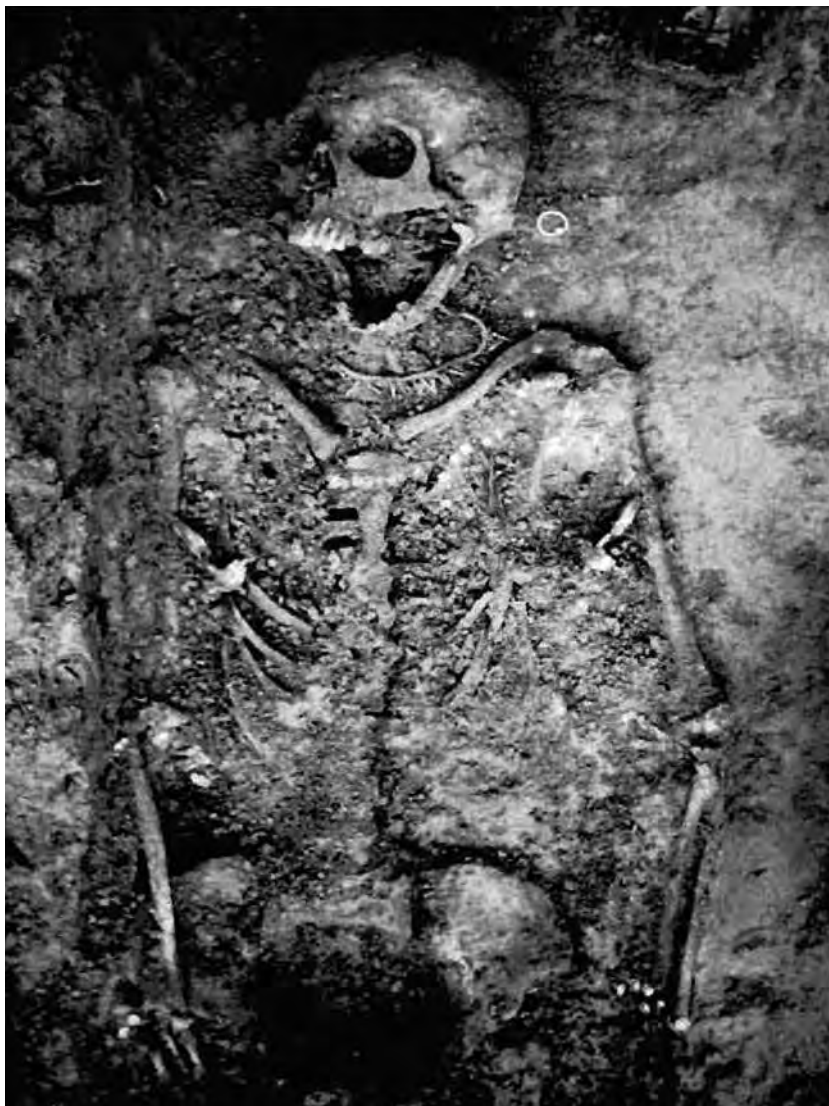
Fig. 1. La tombe de Hochfelden au moment des fouilles (D'après Hatt 1965, fig. 1)