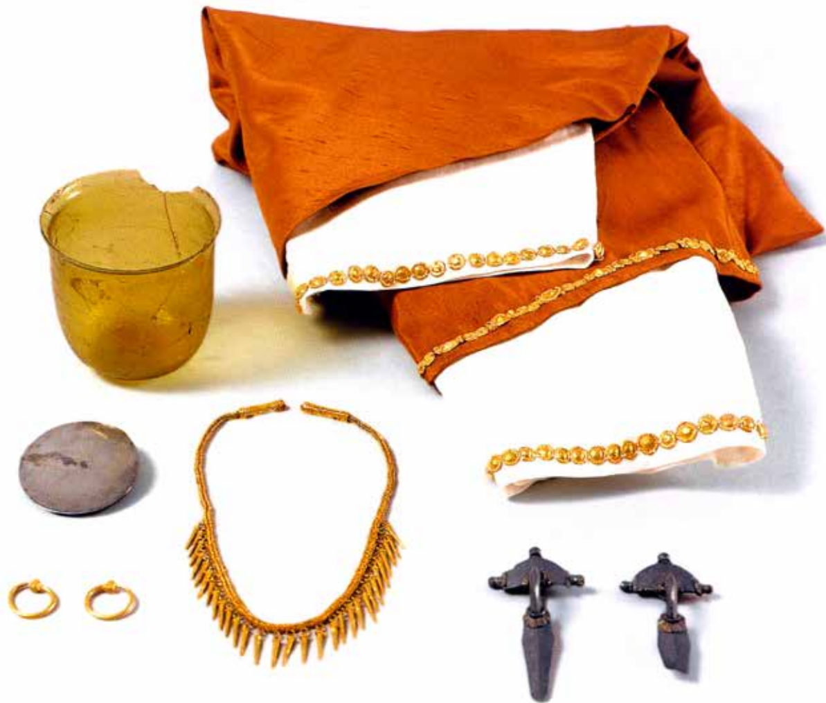
Fig. 3. Les objets venant de la tombe de Hochfelden (D'après L'Or des princes barbares 2000, n° 13)