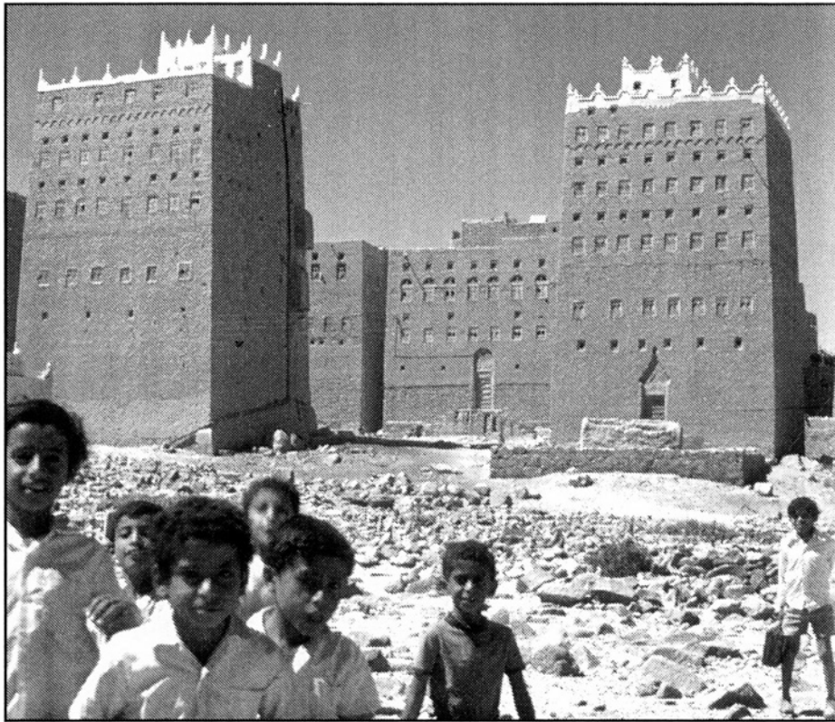
Fig. 2. Maison-tour de Yashbum, région de Shabwa