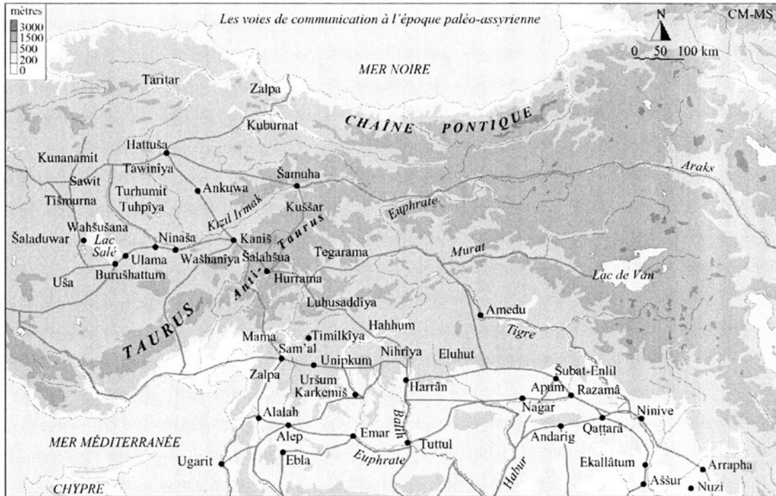
Fig. 1. Les routes commerciales assyriennes en Cappadoce