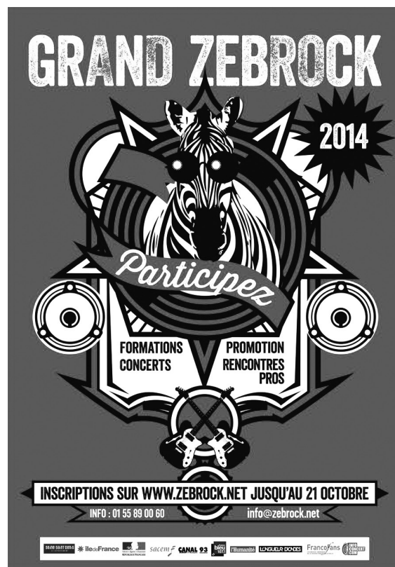
Figure 6 : Affiche Grand Zebrock 2014

On a, sur des bases sérieuses, construit progressivement le projet Zebrock. Ces dernières années, nous avons par exemple travaillé étroitement avec le laboratoire en sciences de l'éducation Escol-Circeft de l'université Paris 8. Nous avons accueilli une doctorante dans l'équipe, via une convention