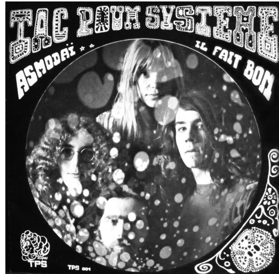
Figure 3 : 45 tours simple, Tac Poum System, « Asmodai / Il fait bon », TPS, 1971

L'été suivant, j'ai 14-15 ans, je pars en colo linguistique en R.D.A. Drancy était évidemment jumelée avec une ville de R.D.A., Eisenhüttenstadt. Le comité de jumelage de la ville organisait ce séjour et comme je faisais de l'allemand en première langue... À l'époque, il y avait cette mode des mallettes noires d'un format de 30 cm. Donc, je partais avec mes disques en colo. Je partais du principe que je trouverais sûrement un électrophone ! Et ceci se vérifiait à peu près toujours, d'ailleurs ! Je les ai emmenés en colo, en Tchéco par exemple, MES disques, quoi. En R.D.A., le moniteur était le bassiste d'un groupe local, Tac Poum Système – un mec sympa. Là-bas, on parlait beaucoup de musique, et évidemment le préado, face au grand, cherchait à frimer un peu... « Et tu connais Cactus ? » – parce que j'avais du Cactus, j'étais très branché par des groupes comme ça. « Et ça, tu connais ? Et Mountain ? », etc. On quitte Eisenhüttenstadt pour aller dans une auberge de jeunesse en Thuringe, et là se produit un truc qui m'a complètement abasourdi. Ce