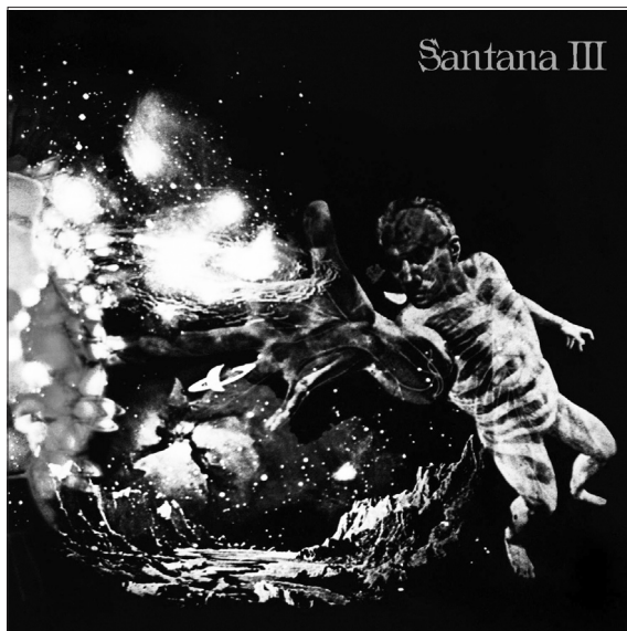
Figure 1 : Album, Santana, III, Columbia, 1971

des guitares de Fogerty... Bob Dylan, c'est un peu court. Je ressentais chez les gens qui parlaient de Dylan cette espèce d'aridité un peu scolaire qui consistait à écouter de bons textes. C'est un vrai problème parce que mon oreille est ainsi faite, que quand j'écoute des chansons en français j'ai beaucoup de mal à en mémoriser les textes. Je suis très jaloux des gens qui mémorisent les textes tout de suite... J'ai des collègues cent fois moins mélomanes que moi : ils écoutent une chanson et ils retiennent tout de suite !