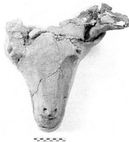
Fig. 3. Dikili Tash : Bucrane.

La méthode d'étude des fragments de terre à bâtir qui a été mise au point a permis la reconstitution des techniques de construction des différentes structures plus ou moins bien conservées in situ. Elle a aussi permis de relier entre eux des éléments architecturaux éparpillés dans la fouille et de reconstituer l'espace intérieur des pièces fouillées. Elle montre tout l'intérêt qui doit être porté à ce type de vestiges qui livrent beaucoup d'informations techniques sur l'architecture préhistorique.