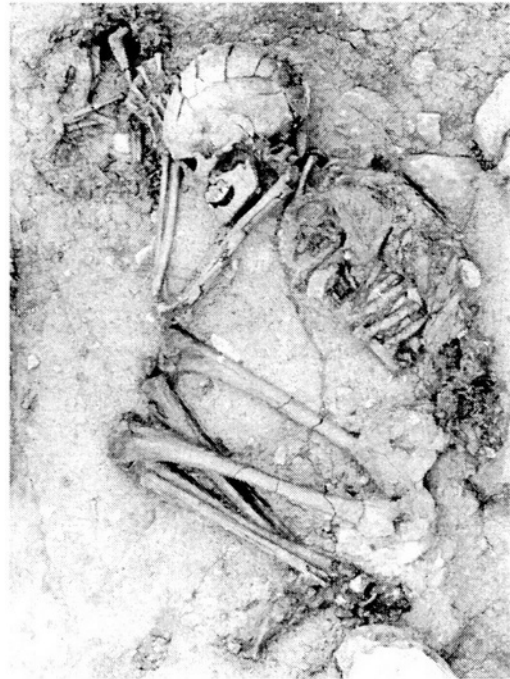
Fig. 3. H104 inhumé avec un chiot (Perrot & Ladiray, 1988)

L'inhumation primaire simple est le traitement le plus courant des cadavres à l'époque natoufienne. Toutefois, 23 % des défunts bénéficient de funérailles en plusieurs temps, identifiées grâce à la découverte de sépultures primaires ayant fait l'objet de prélèvements (3 %), ou bien de sépultures secondaires (20 %). Il n'y a, sur un même site, aucune complémentarité entre les os prélevés et les os inhumés, ni dans la composition ostéologique des, ni dans leur fréquence, ni dans la fraction de population concernée. Plusieurs indices suggèrent que les prélèvements ne sont pas fortuits mais programmés dès le dépôt primaire du cadavre. C'est dans la grotte d'Hayonim que les dépôts secondaires sont les plus fréquents, notamment à la période récente de l'occupation du site. Dans ce contexte, le dépôt d'os est systématiquement associé à une inhumation primaire : le cadavre est déposé dans le fond de la fosse qui peut être surcreusé en gouttière, et les os disloqués viennent le recouvrir. Les nombreux restes humains brûlés de Kébara — à l'état sec pour la plupart — posent la question de l'existence de crémations dès le Natoufien. Cependant, les os ont été soumis à une température peu élevée et leur combustion est incomplète et hétérogène, de sorte que le caractère délibéré de cette pratique demande à être confirmé par la découverte de cas similaires.