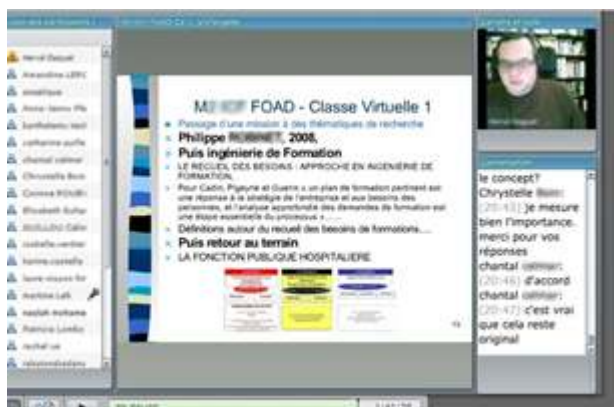
Figure 1. Copie d'écran de classe virtuelle (Adobe Connect)