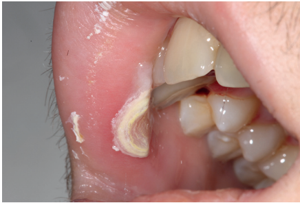
Figure 3 : Ulcération du versant muqueux de la lèvre supérieure. Les versants muqueux labiaux sont également à risque pour les lésions de mucite. Une pseudo-membrane blanchâtre telle que celle observable ici recouvre souvent les ulcérations.

La chimiothérapie, parfois associée à la radiothérapie, réduit la capacité de régénération des muqueuses 24 et tout élément irritant peut rendre chronique une ulcération buccale, avec un risque infectieux majeur pour le patient 3,11 .