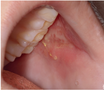
Figure 2 : Érythème et érosion de la muqueuse jugale. Les zones postérieures des joues, en regard des molaires supérieures, sont très fréquemment atteintes. La coloration jaune est due à la prise de Fungizone®.