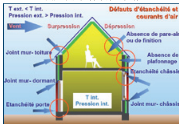
Figure 1 : Défauts d'étanchéité et courants d'air dans les bâtiments

Un mauvais dimensionnement d'un système de chauffage ou de climatisation par rayonnement peut aussi induire des températures de parois inadaptées. Vérifier l'installation est alors indispensable pour corriger le dysfonctionnement.