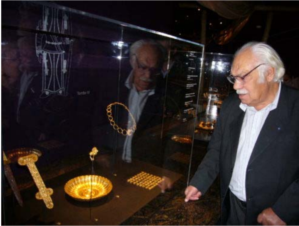
Fig. 3 : Viktor Ivanovich Sarianidi lors du vernissage de l'exposition « Afghanistan, les trésors retrouvés » au Musée Guimet en décembre 2006