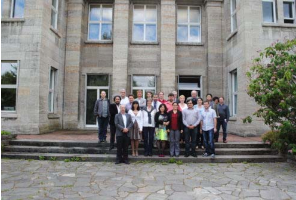
Fig. 2. Les participants au colloque le 23 juin 2014 à Berlin