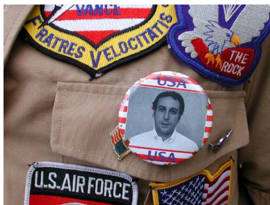
PHOTO 3. – Badge Cevin Soling porté par les dignitaires John Frum, Tanna, 15/02/2006

ment devenir John Frum. » (Soling, in bande-annonce de Guinan et Soling, 2011)