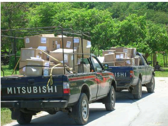
PHOTO 1. – Pick-ups transportant les cadeaux-cargo de Cevin Soling à Tanna, 15/02/2005

interdire de stationner leurs troupes sous le cratère du volcan, jusqu'à ce qu'ils admettent qui sont leurs véritables héros. » (Martin-Jordan, 2007 : 50 min 20 s)