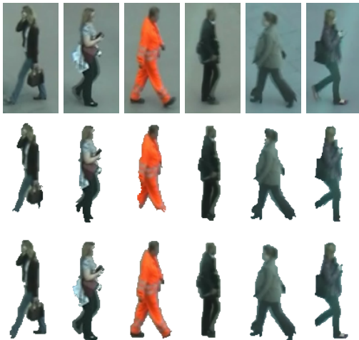
FIGURE 3 – Extraction de silhouettes sur PRID2011[12] (images originales, résultats de [5] et de la stratégie 3).

2 un modèle d'apparence à base d'histogrammes globaux, la stratégie 3 un modèle d'apparence à base d'histogrammes en bandes et cela permet des améliorations. La stratégie 3 fournit toujours des résultats bien meilleurs que les résultats de base de [5] et cela montre les avantages des étapes considérées. Cela entraîne cependant un léger surcoût de calcul, mais qui reste compatible avec du temps-réel. L'ajout d'une information de saillance (stratégie 4) peut permettre d'améliorer les résultats sur quelques bases, mais au détriment du temps de calcul. L'ajout de pré-traitement de filtrage et d'invariants couleur permet également des gains, mais à nouveau au détriment du temps de calcul. La stratégie 6 reprend la stratégie 3 avec des superpixels pour l'étape de raffinement, et cela entraîne une perte de précision due au fait que la décision est prise au niveau du superpixel et celui-ci peut être imprécis. Enfin les stratégies 7 et 8 remplacent le modèle de forme moyen de la stratégie 3 par des modèles de formes multiples. Le temps de traitement reste comparable à la stratégie 3, mais les résultats sont un peu en deçà. Ce résultat peut sembler surprenant, mais confirme des résultats similaires obtenus dans [7, 5]. La stratégie 3 est au final la stratégie que nous retenons pour le bon compromis qu'elle réalise entre performances et temps de traitement tout en surpassant l'état de l'art de [5]. La figure 3 présente des résultats sur PRID2011.