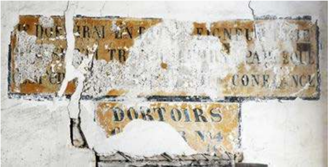
Inscription à l'entrée des dortoirs de la « Grant maison » au premier étage. « Je dormirai en paix Seigneur et je reposerai tranquillement car c'est en vous Seigneur que j'ai toute ma confiance » et, en dessous « Dortoirs – Couloir n° 4 ».

à « Vive les zouaves », il renvoie à la possibilité d'être libéré par anticipation pour incorporer l'armée 25 .