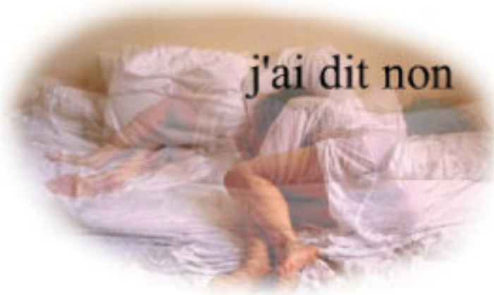
Figure 3. Ne me touchez pas , d’Annie Abrahams (2003)

Prenons un autre exemple. Ne me touchez pas 7 est un court récit interactif en ligne. La pièce, très simple, présente une femme allongée. Une voix de femme – celle de l’auteur, Annie Abrahams – raconte une anecdote. « Ne me touchez pas raconte un rêve que j’ai fait quand j’étais adolescente », confie l’auteur. Ce rêve peut être interprété comme le passage parfois douloureux de l’adolescence à l’âge adulte d’une jeune femme exposée au regard et au désir des hommes. L’internaute écoute, mais peut expérimenter dans le même temps une action avec sa souris (survol, clic). Néanmoins, à chaque caresse avec le curseur de la souris sur l’image, la jeune femme change de posture en exprimant (textuellement) son refus. Le récit vocal s’interrompt alors et recommence au début. A la quatrième tentative de caresse avec la souris, le récit vocal s’arrête définitivement.