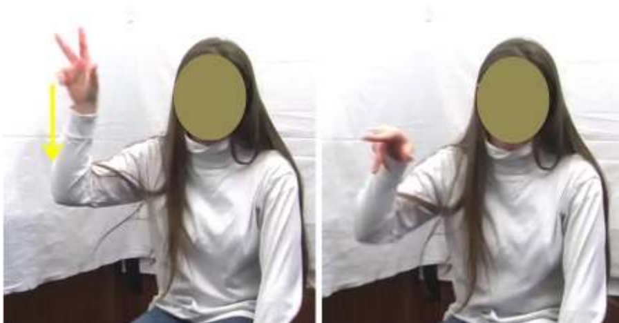
Figure 15 : sapin6