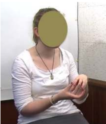
Figure 13 : Boule de Noël5_sapin5