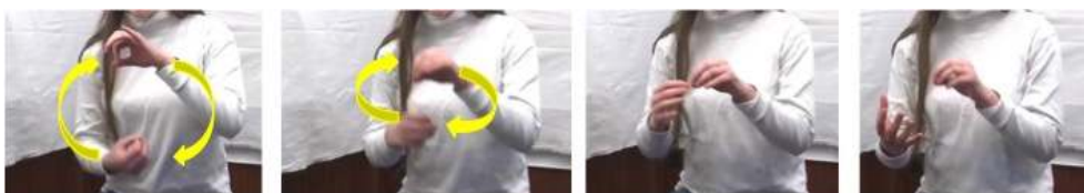
Figure 4 : Fil de fer1