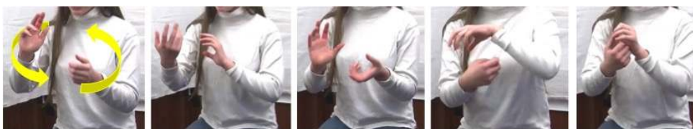
Figure 6 : Fil de fer2