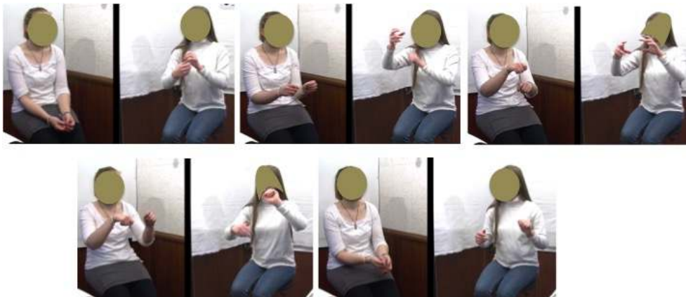
Figure 7 : Fil de fer3