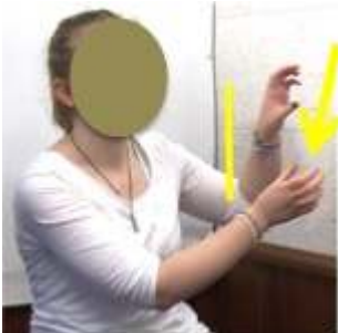
Figure 11 : Boule de Noël3_sapin4