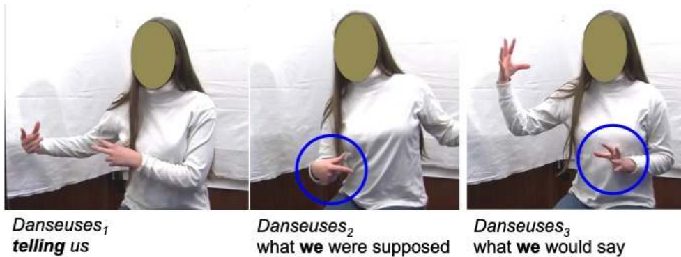
Figure 2 : Gestes illustrant la scène des danseurs

2008) de manipulation du discours ( speech-handling gesture , Streeck, 1994 ; 2009) permettant de focaliser l'attention de l'interlocuteur sur un segment du discours, en l'occurrence la relative nominale « what we would say » (« ce que nous devons dire »), en le présentant comme un objet concret, réifié, manipulable.