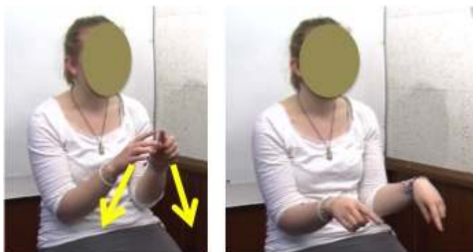
Figure 8 : Fil de fer4_sapin3

articulatoire, visant probablement à rendre l'expression gestuelle la plus claire et intelligible possible pour la non-native (voir aussi : Adams (1998) et Tellier & Stam (2012) sur les gestes associés au foreigner talk ).