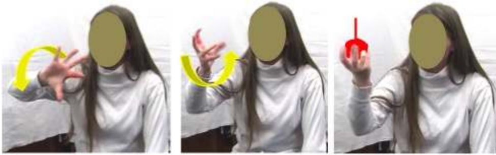
Figure 10 : Boule de Noël2