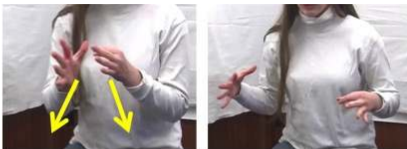
Figure 3 : Sapin1