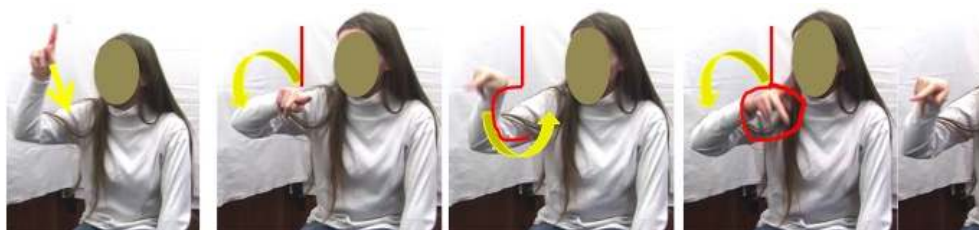
Figure 9 : Boule de Noël1