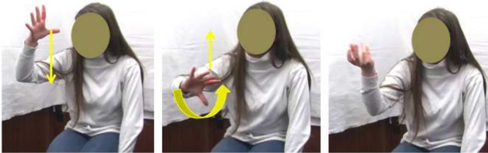
Figure 14 : Sapin6_boule de Noël6

verticale. La représentation visuelle du sapin est encore plus réduite dans sapin 6 que dans sapin 4 (Figure 11), dans la mesure où le segment de l'avant-bras de la locutrice native matérialisait le trait de verticalité dans sapin 4 , alors que le traçage vertical devient immatériel dans sapin 6 .