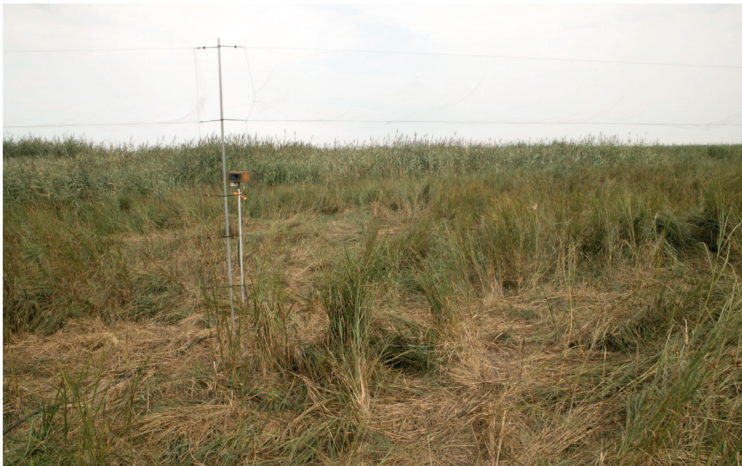
Fig. 12 Filet de capture et enceinte de diffusion des chants de passereaux paludicoles du camp de baguage de l'association ACROLA à Donges en juillet 2018.