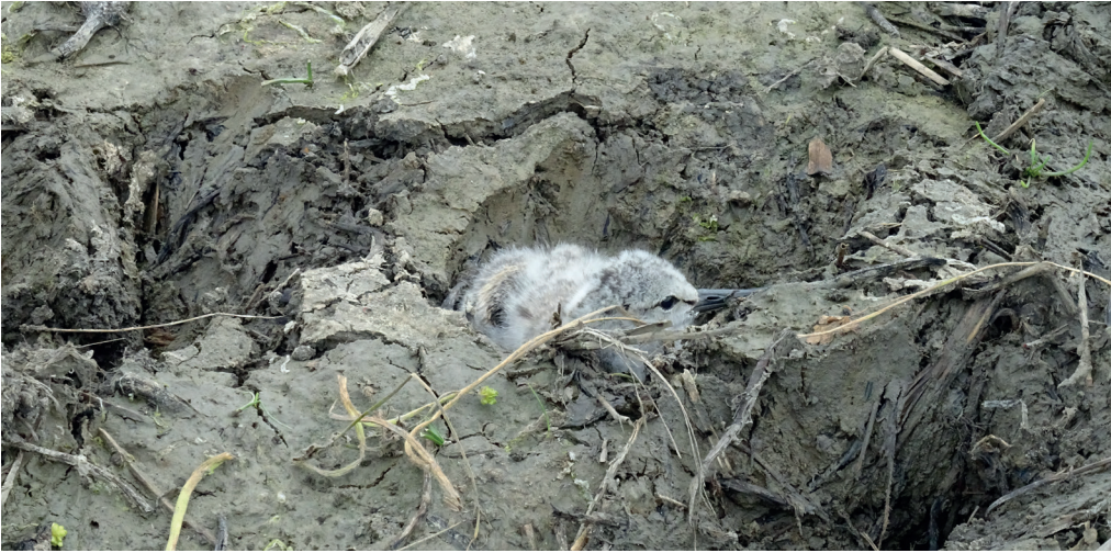
Fig. 13 Poussin d'Avocette élégante, immobile dans une empreinte de sabot de vache où il s'est plaqué, alors que ses parents poussent des cris d'alarme à l'approche de la photographe.