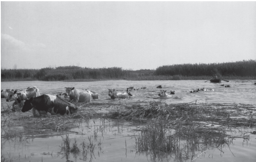
Fig. 4 Retour des vaches à la nage depuis l'île Chevalier en 1972.

Peut-on dire que c'est une coévolution entre cette activité d'élevage et les dépôts sédimentaires qui a formé ces îles qui sont maintenant pratiquement à 70 % des prairies ?