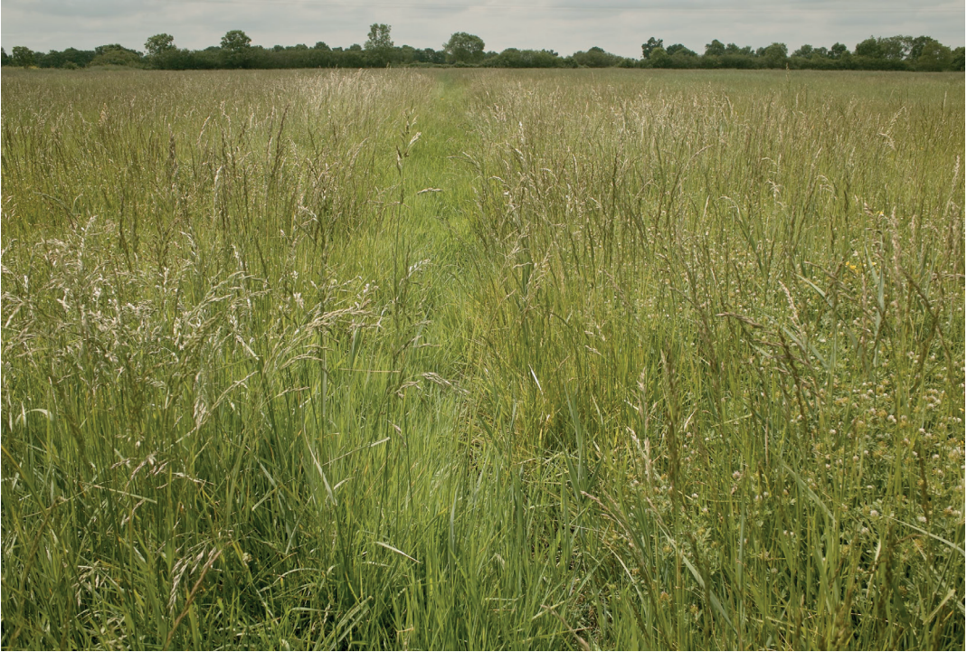
Fig. 5 Prairie de fauche installée sur des dépôts de colmatage au long de l'étier du Syl à Lavau : la douve qui a été creusée afin d'irriguer et colmater la prairie avec le flot de marée et ses sédiments n'est plus entretenue mais se devine encore. © Éric Collias (mai 2019).

la région (Marchand, 2017) et nous interroger sur le lien de celui-ci avec le potentiel économique de cet élevage littoral.