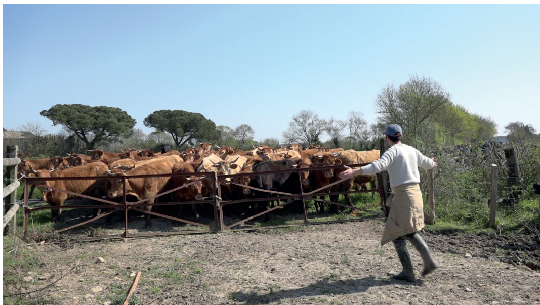
Fig. 9 Bénévole de la transhumance vers l'île Chevalier le 30 mars 2019, positionné pour empêcher le troupeau de s'égarer hors du chemin assigné, qui n'a cependant pas respecté la consigne qui était de ne pas porter de vêtements clairs afin de ne pas effrayer les vaches.

aux bécassines, car il leur offre des surfaces de prairies supplémentaires où s'alimenter pendant leur halte migratoire estivale.