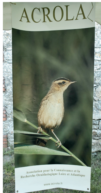
Fig. 11 ( ci-contre ) Phragmite aquatique, photographiée sur le camp de bagage de Donges par Philippe Zen, exposée lors de la transhumance du 8 avril 2017 à la ferme de Mareil. © Éric Collias.

vaches leur goût pour le végétal, le groupe des canards et des oies, dont le nombre peut atteindre une cinquantaine de milliers d'individus en période hivernale, est un des plus importants groupes d'oiseaux à fréquenter les îles et les prés de côte de l'estuaire. La présence du collectif de vaches et d'éleveurs, qui, nous l'avons vu précédemment, coexistent avec la prairie naturelle, permet aux oies et canards de s'attacher à ces lieux, où ils partagent l'herbe des vaches, tandis que les bécassines y cherchent les vers au bord des mares fréquentées par les bovins. Ainsi, Jéronez (1944) dans son ouvrage consacré à la chasse dans les estuaires, explique rechercher « les environs des mares à bestiaux [...] qui viennent de boire [et] ont des réactions intestinales nombreuses. Chacun sait que, sous les fientes, les vers s'y multiplient ayant bonne table et douce chaleur ». Les chasseurs sont par conséquent des alliés implicites de cette coexistence. En témoignent les passerelles qui sont construites lors de corvées communes et qui conservent parfois le sceau de cette alliance par les initiales des bâtisseurs tracées dans le béton (fig. 10).