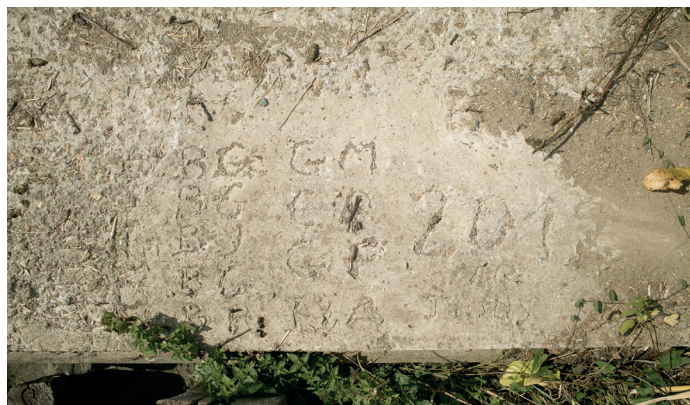
Fig. 10 ( ci-dessus ) Les initiales des éleveurs et chasseurs ayant participé à une corvée commune pour la construction de la passerelle du Tertre-Rouge qui relie l'île Pipy sont tracées dans le béton.