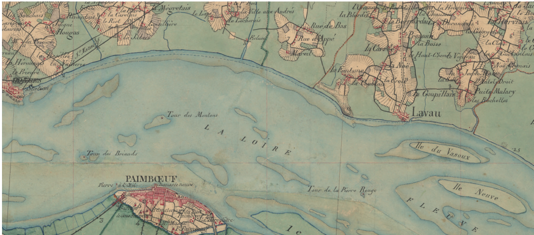
Fig. 2 Carte d'État-major de 1848 : deux îles sont déjà formées en face de Lavau, l'île du Vasoux (aujourd'hui île de Lavau) et l'île Neuve (aujourd'hui île Pipy), et les prémisses des futures îles Pierre-Rouge et Chevalier apparaissent entre la tour de la Pierre Rouge et la tour des Moutons.

Nous évoquons dans ce chapitre le Capitalocène (Haraway, 2015) pour différentes raisons. Nous pensons, d'une part, que l'humanité a toujours manipulé les écosystèmes, dans lesquels elle a créé des niches (Descola, 2015). Cependant, parmi les différents modes de composition du monde, c'est le mode capitaliste qui, avec l'accélération des échanges marchands, a extrait sans commune mesure les ressources du globe terrestre. Ainsi, une des caractéristiques de cet estuaire est d'avoir vu le volume oscillant de la marée augmenter progressivement avec le creusement du chenal afin de développer le trafic portuaire depuis Nantes d'abord, puis afin de permettre les navires méthaniers de faire demi-tour devant la raffinerie de Donges.