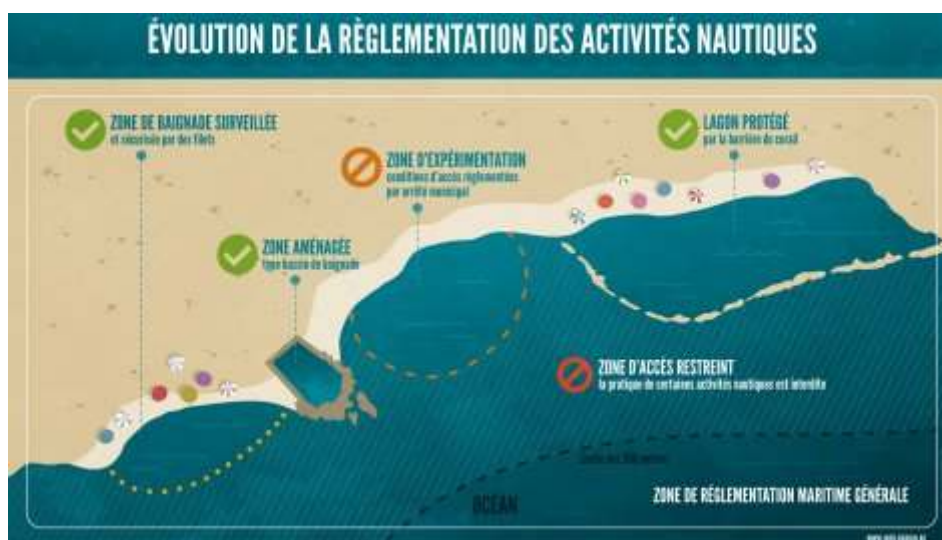
Figure 2. Évolution de la réglementation des activités nautiques.