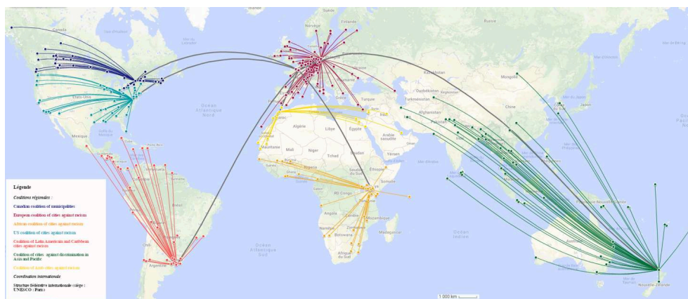
Carte 2 : le réseau ICCAR

Conception et réalisation : Thomas Lacroix, 2019 / Google MyMaps