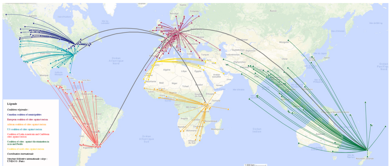
Carte 2 : le réseau ICCAR

Conception et réalisation : Thomas Lacroix, 2019 Google MyMaps