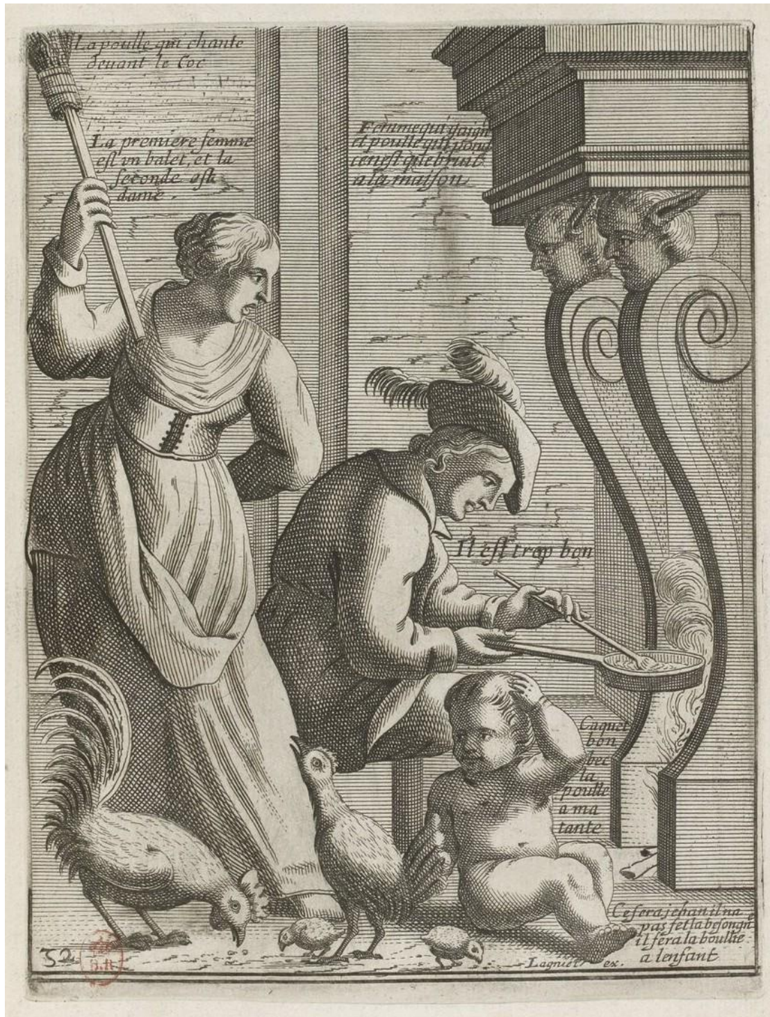
Ill. 3 : Jacques LAGNIET, La Poule qui chante devant le coq (v. 1660), gravure à l'eau-forte, dans LAGNIET, Recueil des plus illustres proverbes, divisé en trois livres , ouvr. cité (estampe 32 du 2 e livre).