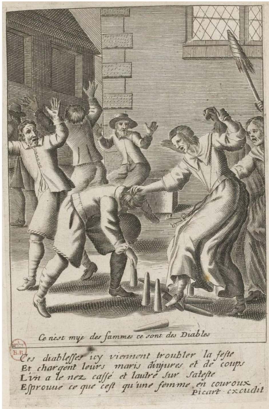
Ill. 2 : Pierre PICART, Ces diableses icy viennent troubler la feste (v. 1660), gravure au burin, dans Jacques LAGNIET, Recueil des plus illustres proverbes, divisé en trois livres : le Premier contient les proverbes moraux, le Second les proverbes joyeux et plaisants, le Troisième représente la vie des gueux en proverbes mis en lumière par Jacques Lagniet , Paris, « sur le quai de la Megisserie au fort l'Évêque », [1663], n.p. (estampe 107 du 2 e livre) : Paris, Bibliothèque nationale de France, Réserve des livres rares, RES-Z-1746.