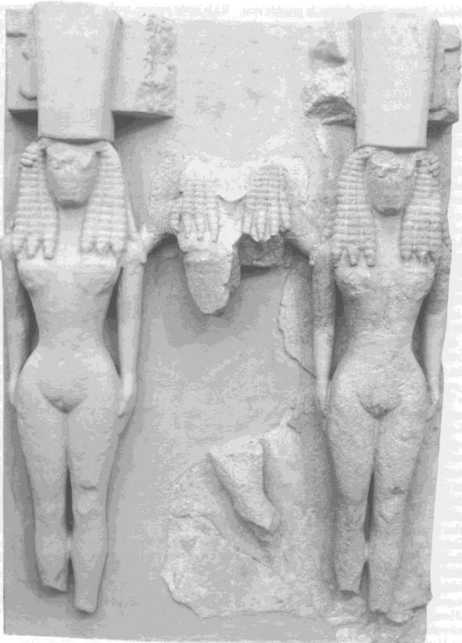
fig. 1 Métope du temple de l'Acropole de Gortyne (sans doute consacré à Athéna). Seconde moitié du VII e siècle. Musée d'Héracléion. Inv. MA379. 1,50 m. Photo du musée.