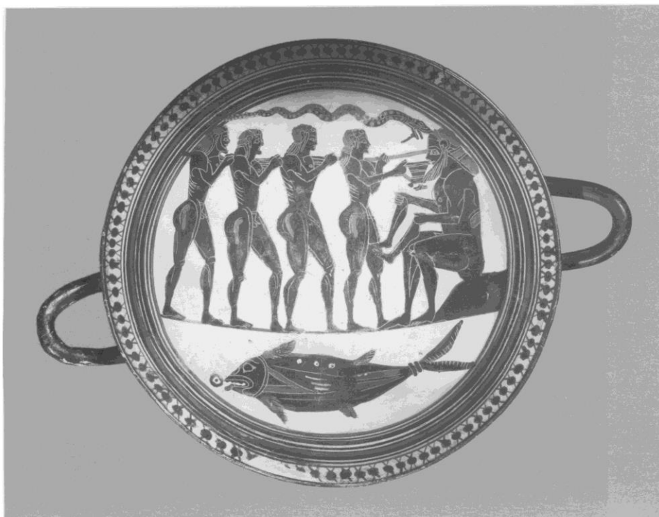
fig. 4 Coupe laconienne. Paris, Cabinet des Médailles, inv. 190. Vers 560-550 av. J.-C.