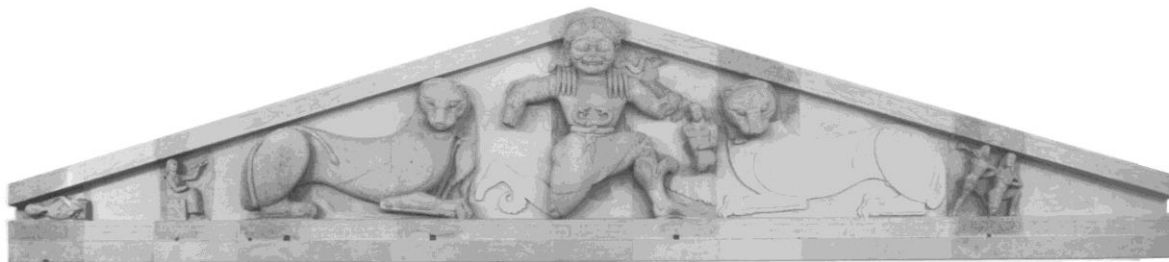
fig. 3 Fronton du temple d'Artémis à Corfou. Vers 580 av. J.-C. Hauteur totale : 3,15 m. Musée archéologique de Corfou.