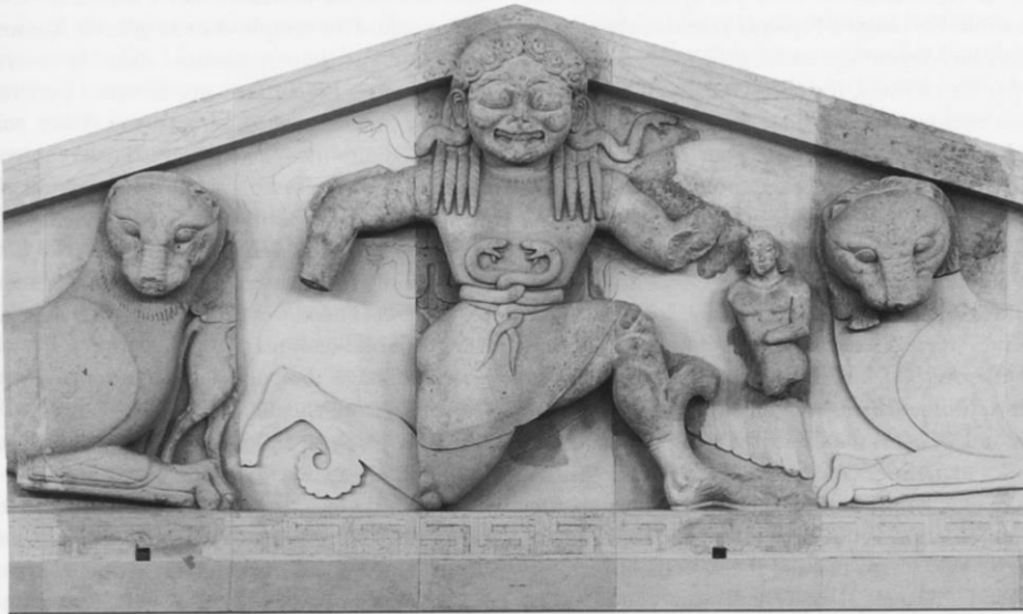
Détail de la fig. 3

Dans le volume 49 d' Égypte, Afrique & Orient , on peut lire ces lignes écrites par Dominique Farout (p. 19) : "l'art égyptien se fonde sur l'aspectivité. Il s'agit de représenter simultanément les différents aspects qui caractérisent le sujet. Ainsi, les artistes égyptiens se moquent de l'unicité de temps et de lieu. C'est une notion extérieure à leur mode de pensée qui apparaît uniquement avec le monde grec.