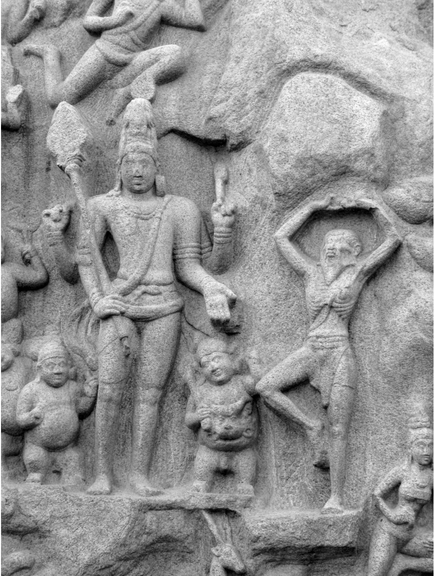
Fig. 3. — Descente du Gange, Śiva et Bhagīratha, Mahābalipuram, VII e siècle.