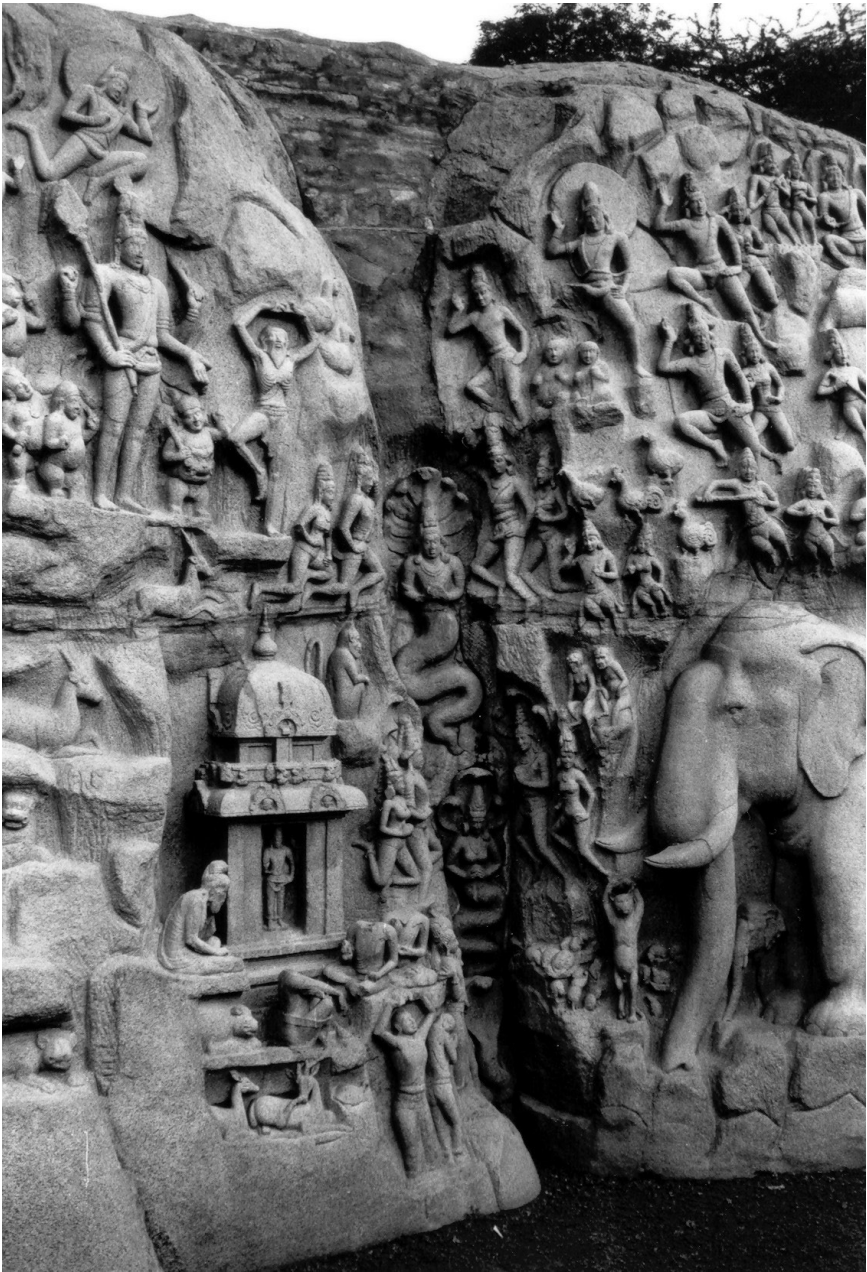
Fig. 2. — Descente du Gange (centre de la composition), Mahābalipuram, VII e siècle.