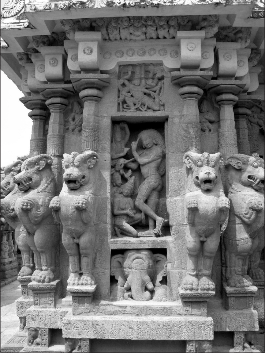
Fig. 6. — Bhikṣāṭanamūrti, face sud du sanctuaire principal, temple de Kailāsanātha, Kāñcīpuram, début du VIII e siècle.