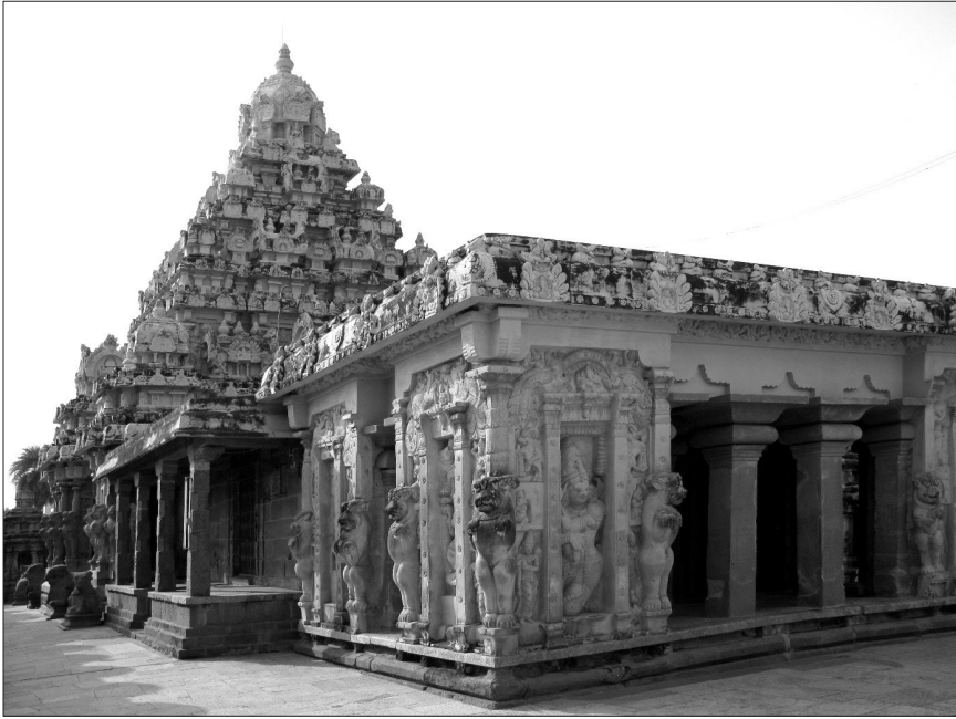
Fig. 4. — Pavillon et sanctuaire principal, temple de Kailāsanātha, Kāñcīpuram, début du VIII e siècle.