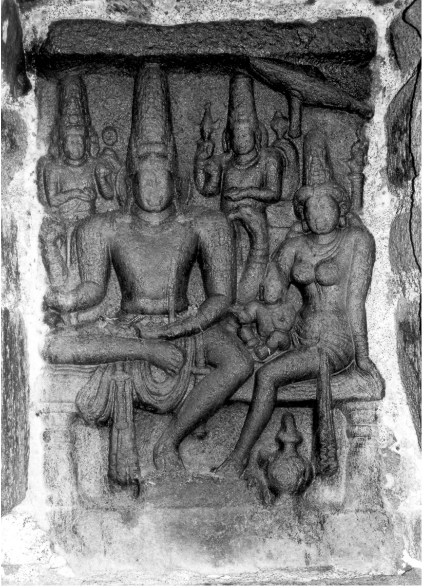
Fig. 8. — Somāskandamūrti, cella du petit temple de Śiva, temple du rivage, Mahābalipuram, début du VIII e siècle.