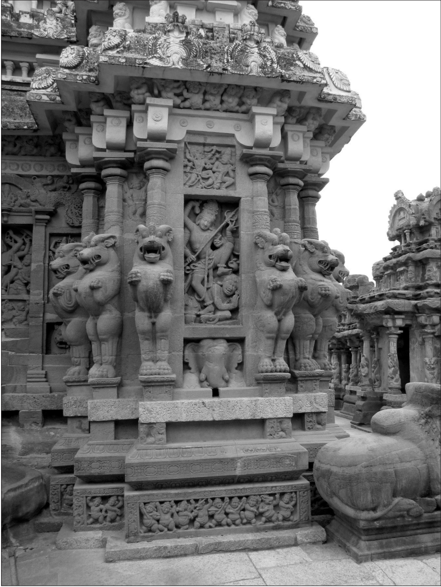
Fig. 7. — Kālārimūrti, face nord du sanctuaire principal, temple de Kailāsanātha, Kāñcīpuram, début du VIII e siècle.