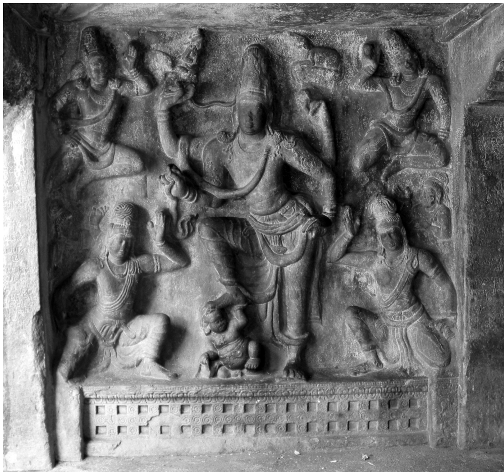
Fig. 1. — Gaṅgādharamūrti, grotte supérieure à Trichy, début du VII e siècle.