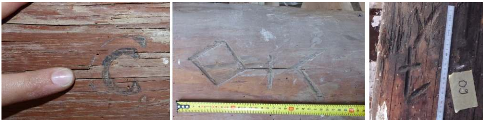
Fig. 2. - Quelques marques identifiées en Basse Provence, dans le pays d'Aix : bastide du Jas de Bouffan, hôtel de Caumont et bastide du Seuil.