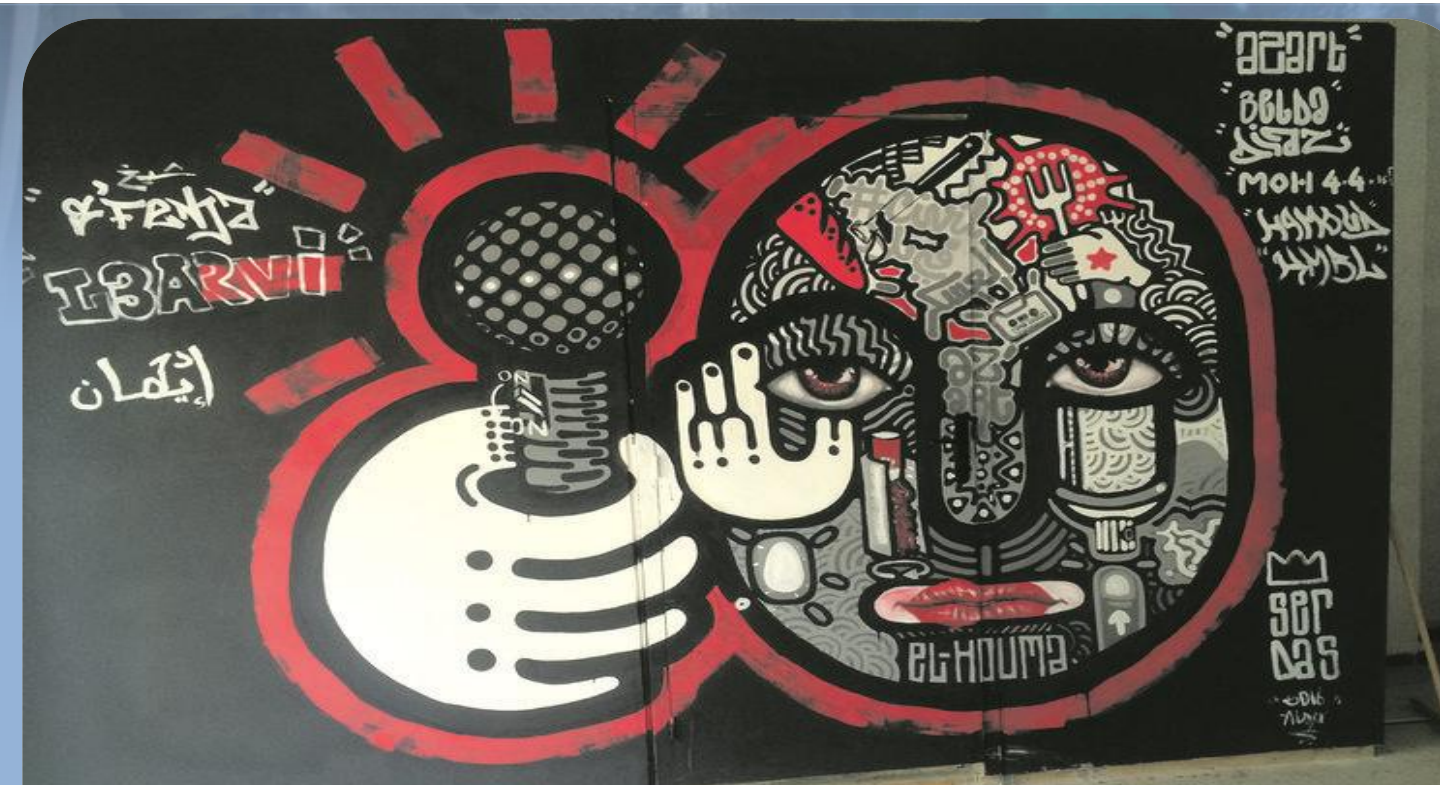
Source: Dans les locaux d'El Houma, à Alger. Photo Zohra Ziani http://next.liberation.fr/musique/2016/08/19/el-houma-quartiers-libres-a-alger_1473484