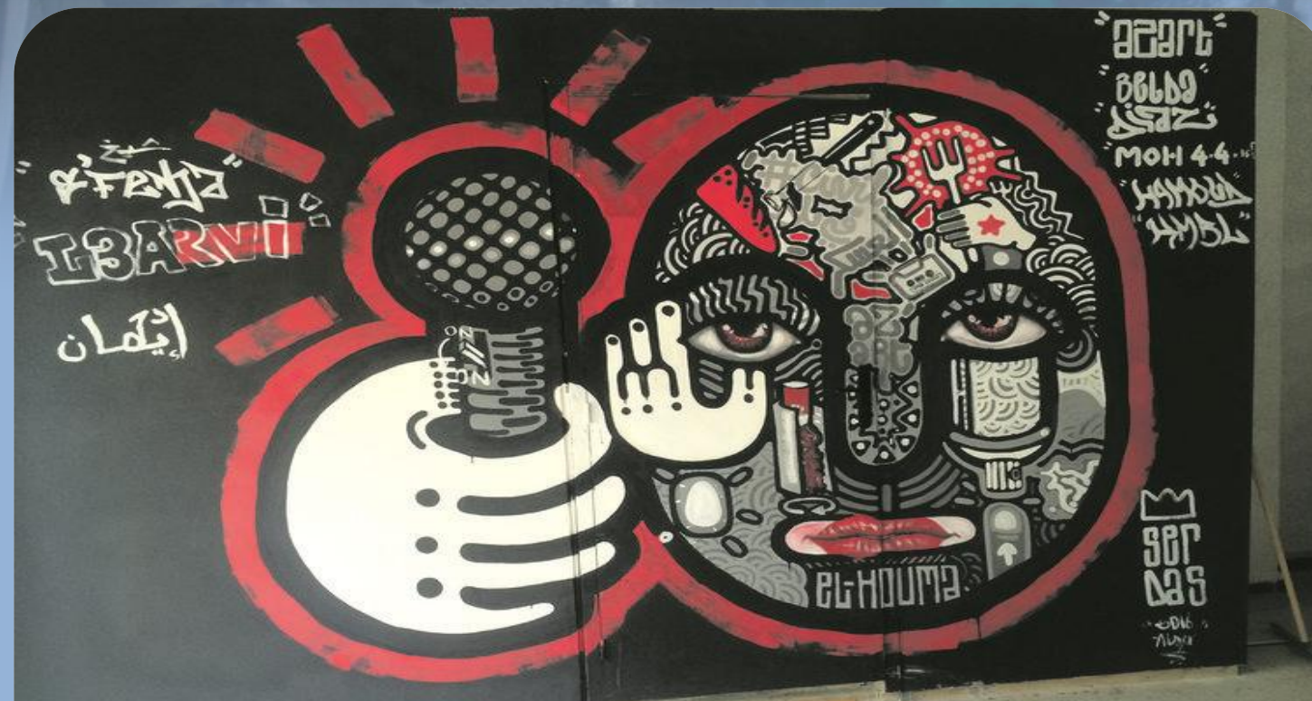
Source: Dans les locaux d'El Houma, à Alger. Photo Zohra Ziani http://next.liberation.fr/musique/2016/08/19/el-houma-quartiers-libres-a-alger_1473484