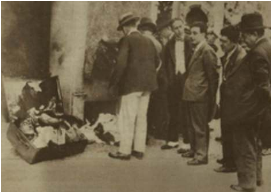
Détective , 21 septembre 1931