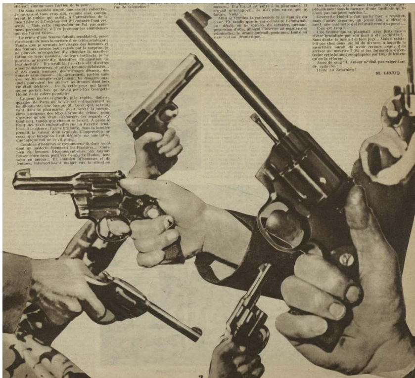
Détective, 12 juin 1930