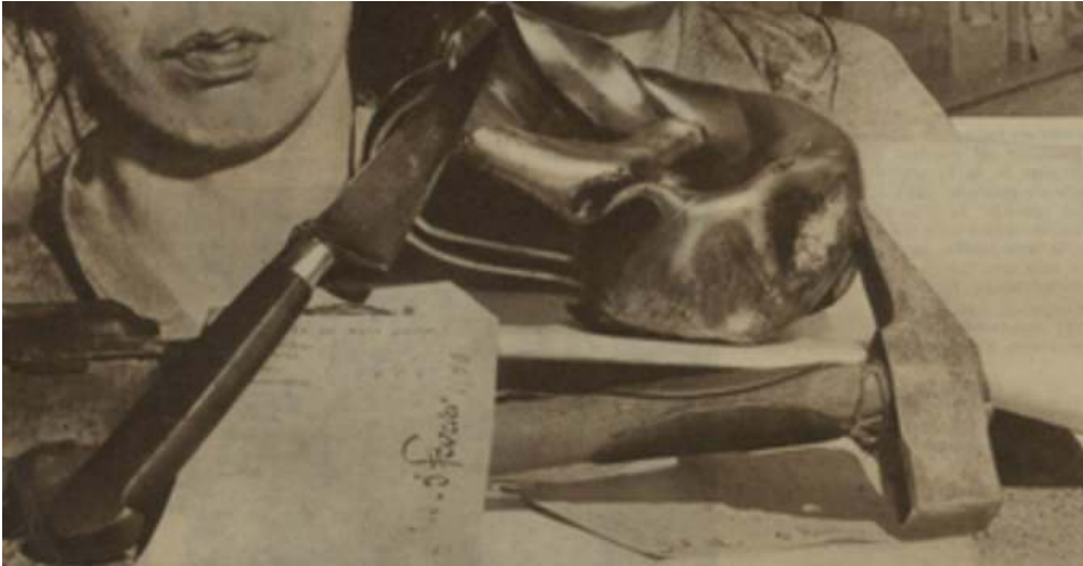
Détective , 9 février 1933