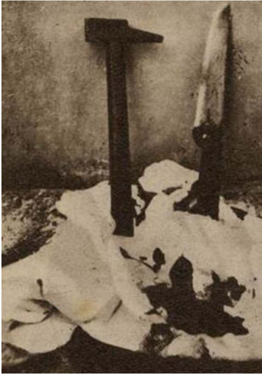
Déetective , 6 décembre 1934