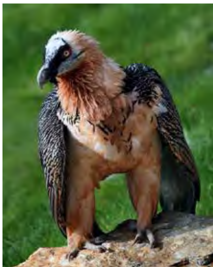
Gypaète barbu ( Gypaetus barbatus )

Je n'en suis pas si sûr. Je ne pense pas que ce sont les images qui résoudront le problème en tout cas.