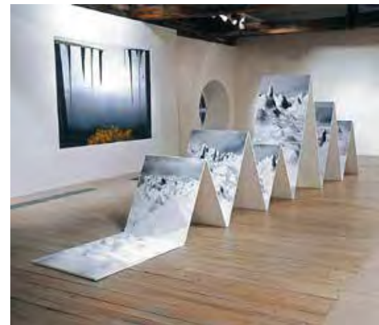
Lionel Bayol-Thémines, High Land (2016), série « Silent Mutation (post-anthropocène) » © Lionel Bayol-Thémines

Je ne suis pas allée chercher dans mes souvenirs, mais plutôt dans un travail assez récent qui clôturait l'exposition Paysage français à la BnF. Il s'agit d'une sculpture de Lionel Bayol-Thémines, datant de 2015 et faisant partie d'un ensemble qui s'appelle Silent Mutation . Après avoir pris des photographies des Alpes, l'artiste a dénaturé ces images en manipulant leur code numérique dans le but de matérialiser l'artificialité de la nature et la façon dont elle est transformée de l'intérieur par nos actions. J'ai trouvé cette œuvre intéressante, car la démarche photographique fonctionne comme un miroir de notre rapport à l'environnement : c'est l'image d'une altération fondamentale 1 .