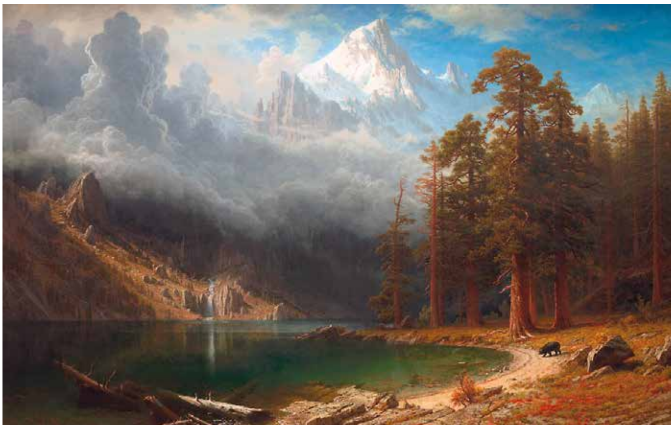
Albert Bierstadt, Mount Corcoran (1876) © National Gallery of Art, Washington/commons.wikimedia

ment à l'origine de ces premiers plans photographiques de plus en plus englobants. Ce changement s'accélère encore avec les fusées de l'ère spatiale. Ainsi, nous nous éloignons de plus en plus du paysage qui nous entoure, dans lequel nous vivons, l'environnement au sens littéral. Ce passage d'un paysage à une vue englobante est très important, car il nous distancie de notre environnement et, en même temps, il nous aide à mieux comprendre les processus terrestres et les enjeux globaux. Nous ne sommes plus dans le paysage. Nous n'avons