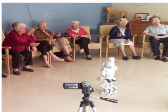
PHOTOGRAPHIE I. ATELIER AVEC L'USAGE DU ROBOT ZORA