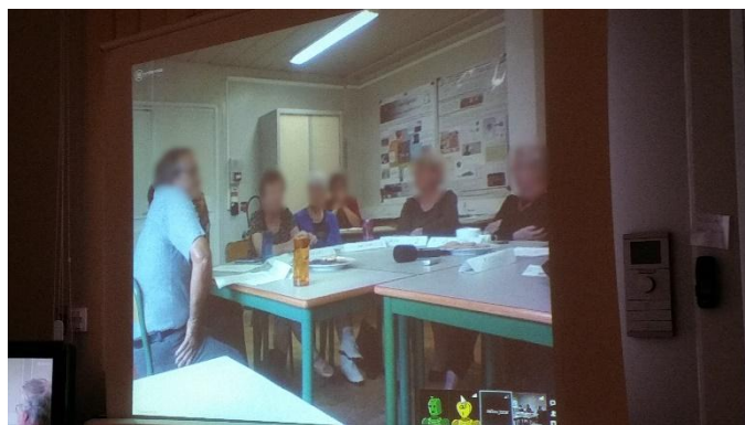
Figure 2. Disposition des participants pour le focus group conduit à la MIB

Lors de ce deuxième focus group (Figure 2), il a été choisi d'intégrer les accompagnatrices après une première phase réalisée uniquement avec les résidents. Le focus group a été mené par le même animateur que celui réalisé au sein de l'habitat partagé de Montredon.