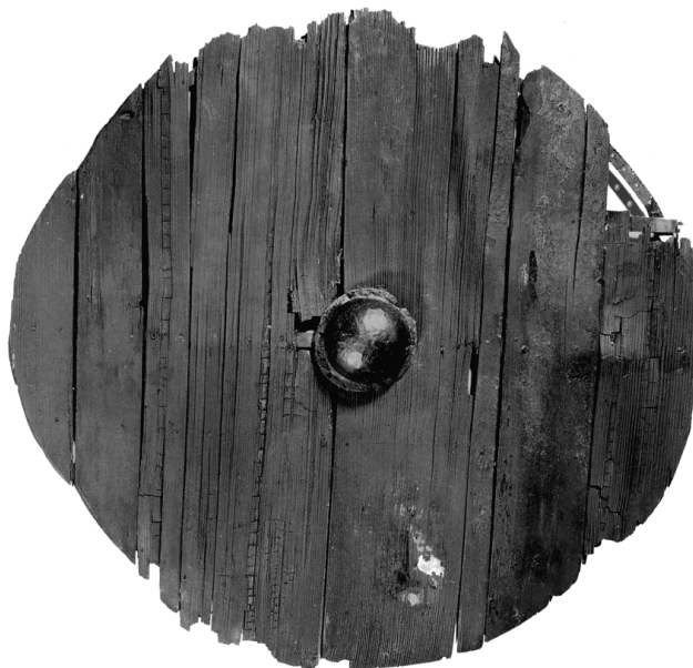
Document 1 : Bouclier de Gokstad (face externe), Vestfold (Norvège), IX e siècle C10390