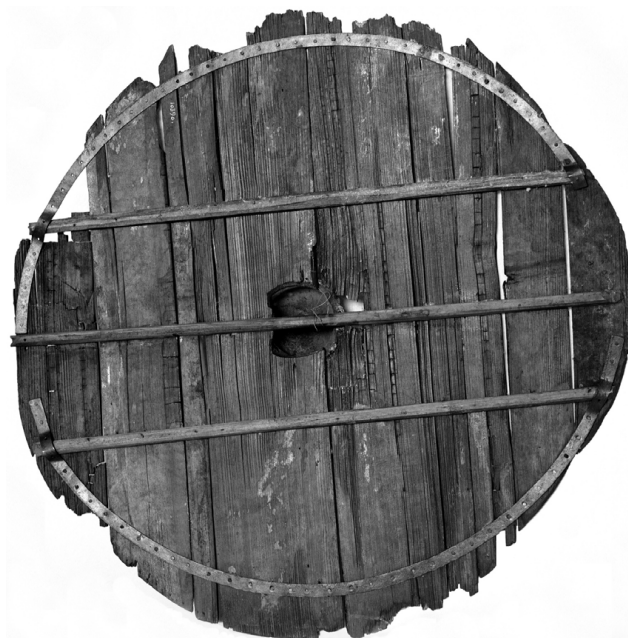
Document 2 : Bouclier de Gokstad (face interne), Vestfold (Norvège), IX e siècle C10390