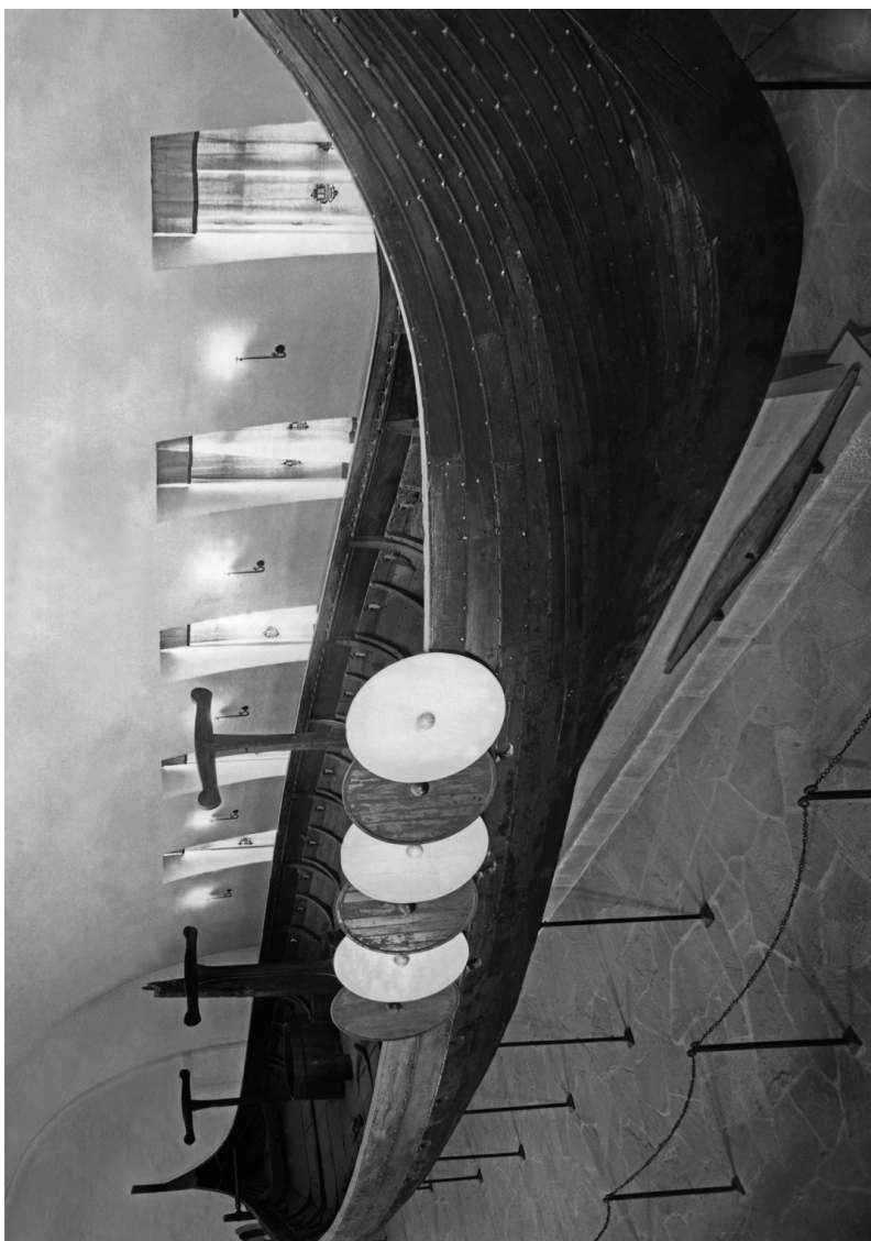
Document 3 : Bateau de Gokstad avec plusieurs boucliers reconstitués, Vestfold (Norvège), IX e siècle C10384