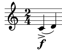
Figure 2. Une liaison de phrasé qui arrive au même moment qu'une indication de nuance et un symbole d'articulation.

A l'intérieur de ce constat se trouve de nombreuses relations – tête de note et articulation, tête de note et liaison de phrasé, tête de note et liaison, liaison et articulation etc. Un modèle relationnel permet d'englober plusieurs règles du même genre sans hiérarchiser les rapports entre les objets. Par exemple, on ne précise pas qu'une articulation fait