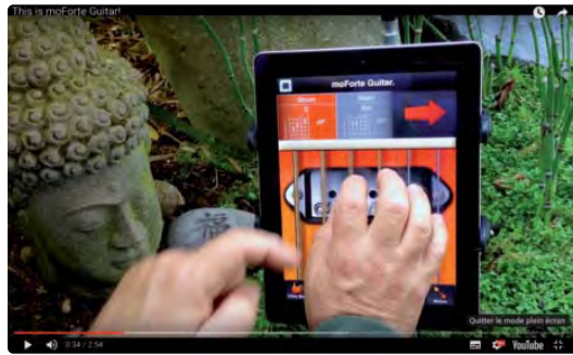
Deux applications réalisées en Faust pour jouer de la musique : GeoShred et Moforte Guitar. www.moforte.com

d'enseignement est l'université Jean Monnet de Saint-Étienne dans le cadre de cours en licence et master. Des cours plus ponctuels ont lieu à l'Ircam (dans le cadre de la formation « Acoustique, traitement du signal, informatique, appliqués à la musique - ATIAM ») et à l'École nationale supérieure d'électronique, informatique, télécommunications, mathématique et mécanique de Bordeaux.