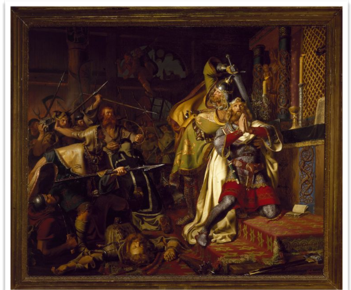
Christian Albrecht von Benzon, Knud den Helliges død (1843)