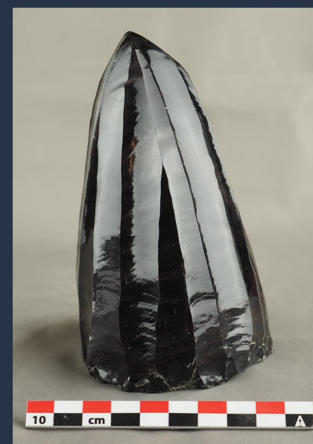
Nucléus en obsidienne de Kültəpə, Nakhchivan.