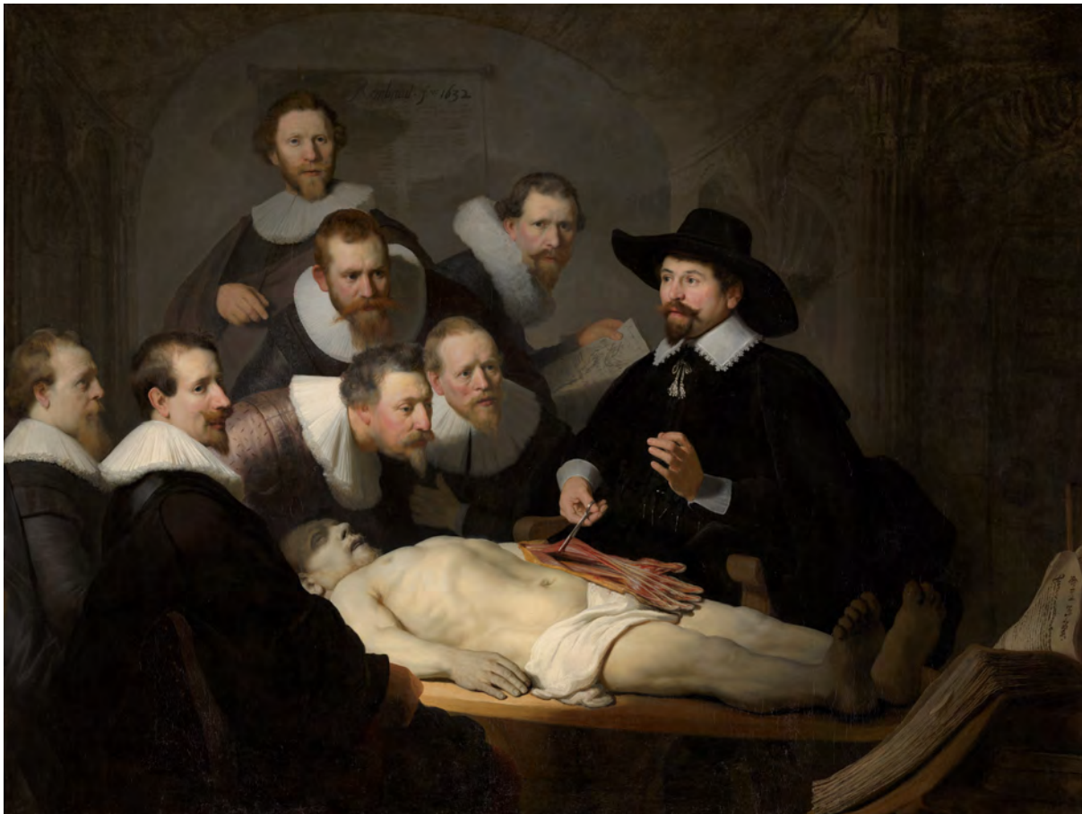
Figure 2. Rembrandt, La leçon d'anatomie du docteur Tulp , 1632.