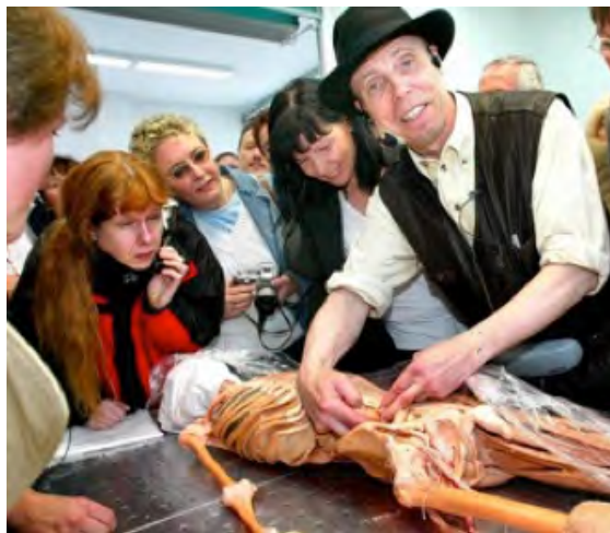
Figure 1. Gunther von Hagens, Séance d'autopsie publique , 2002.

Quand un corps humain dépourvu de vie devient un objet d'art et de commercialisation, peut-on parler de cannibalisme artistique ?