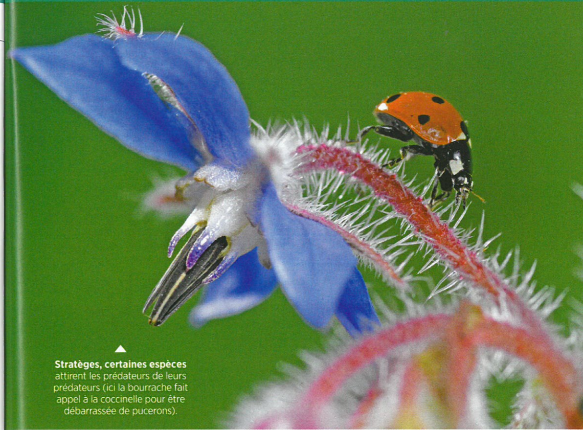
Stratèges, certaines espèces attirent les prédateurs de leurs prédateurs (ici la bourrache fait appel à la coccinelle pour être débarrassée de pucerons).