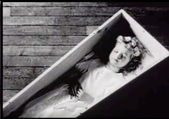
L'effet K 1921-1922