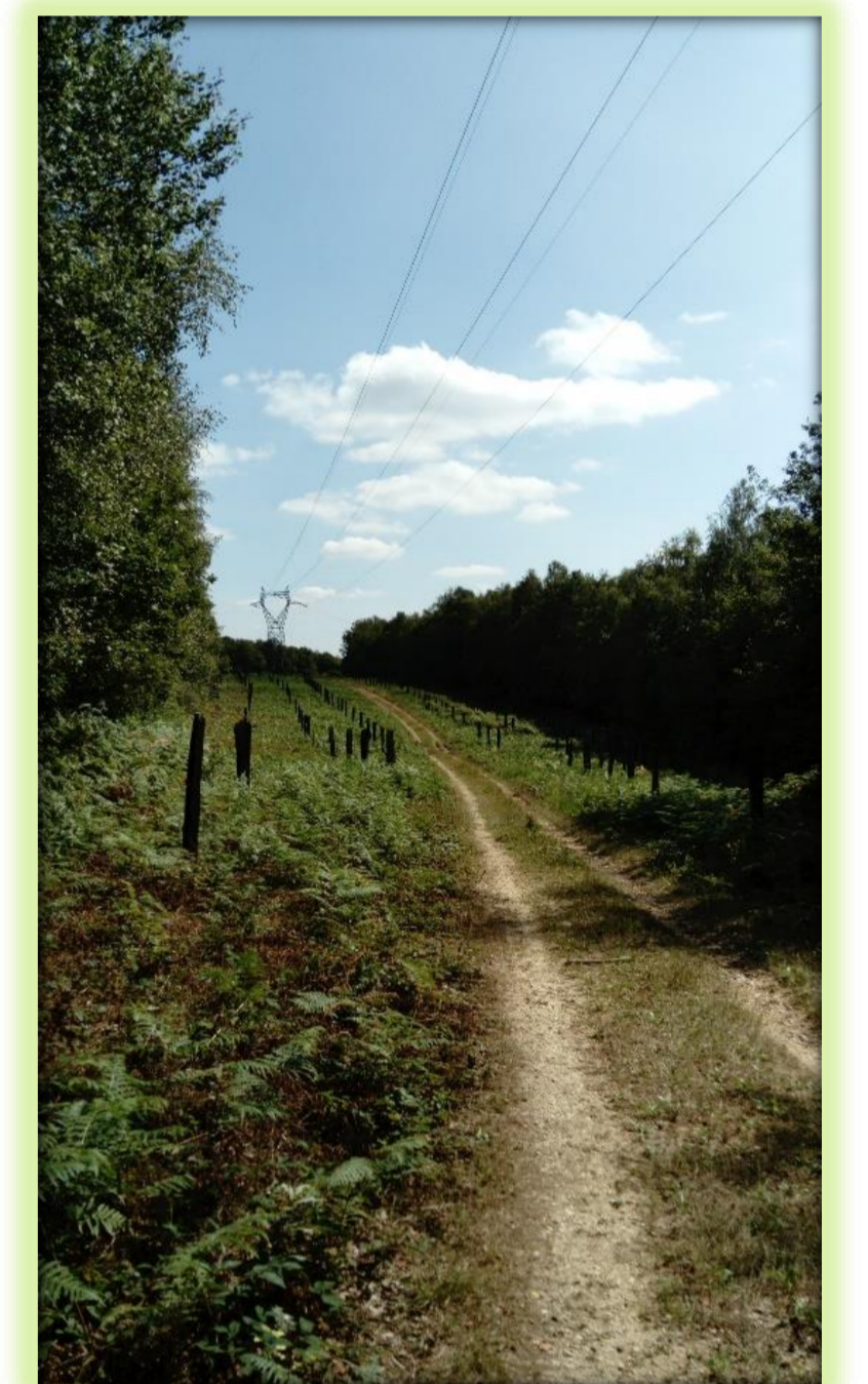
Cas d'étude De: Partenariat RTE - PNR des Ardennes - Commune de Deville - Société de chasse. Réalisation d'un verger forestier à vocation cynégétique dans une emprise de la forêt communale de Deville (Ardennes)