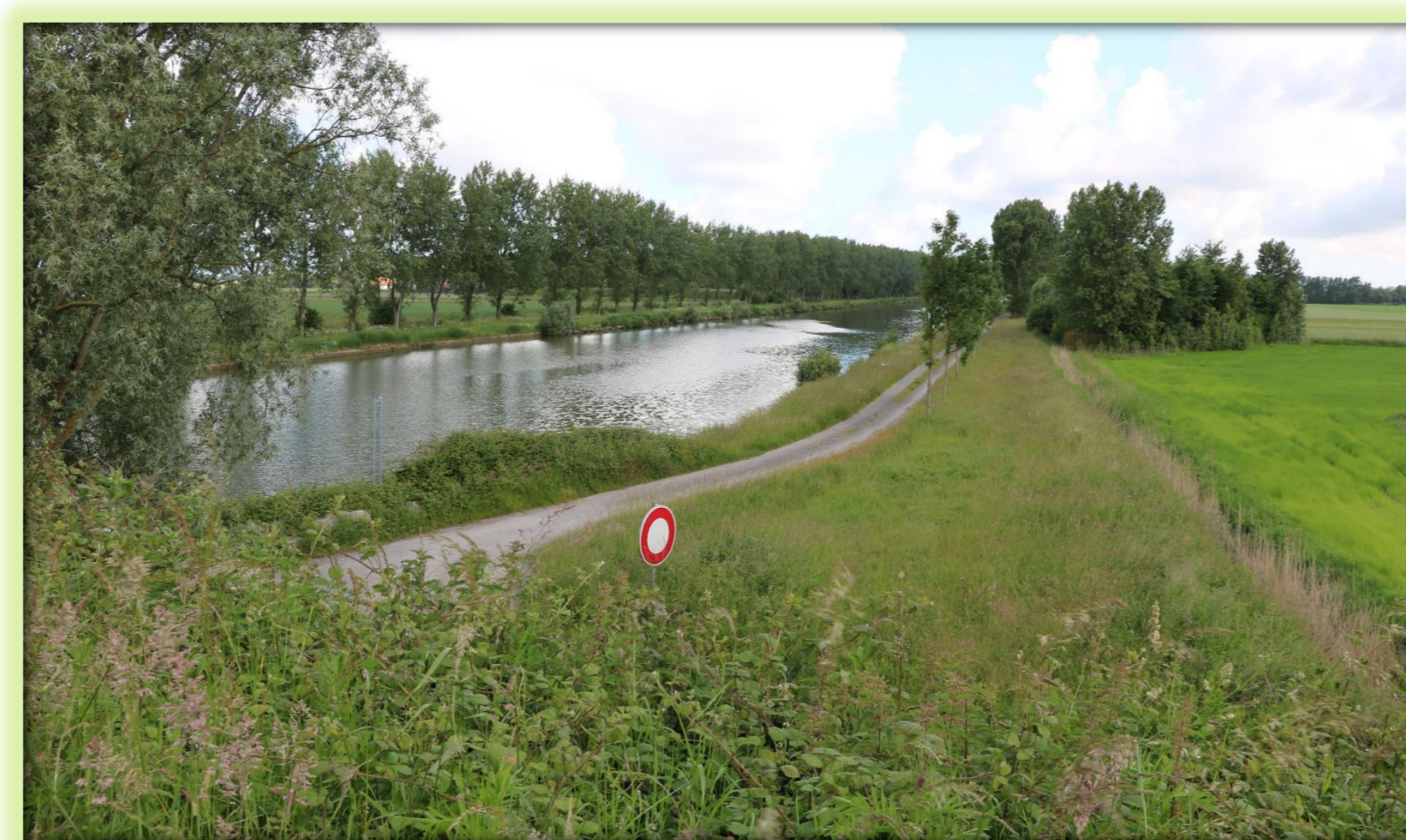
Cas d'étude Du: Partenariat VNF - Association Berger des Flandres. Entretien des bords de la dérivation de la Haute Colme (Nord) par le pâturage itinérant d'un troupeau de 30 moutons