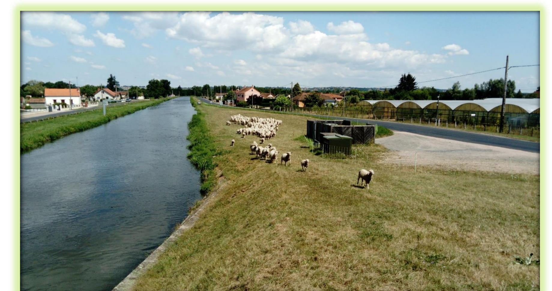
Cas d'étude Di: Partenariat VNF - Eleveur ovin. Entretien des bords du canal de Roanne à Digoin (Allier et Saône-et-Loire) par le pâturage itinérant d'un troupeau de 200 moutons