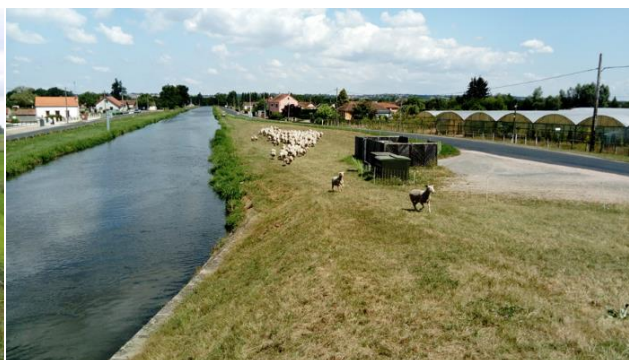
Fig. 2.2 : Troupeau au bord du canal de Roanne à Digoin, commune de Chassenard (03510).