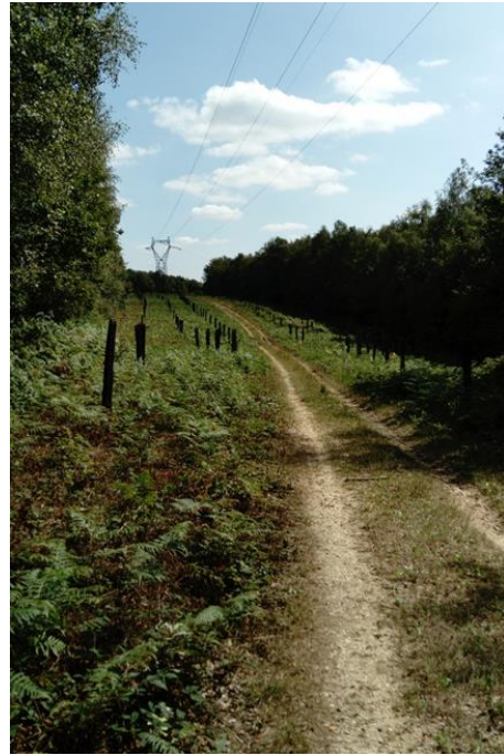
Fig. 2.4 : Verger forestier dans la forêt communale de Deville (08800).

Les quatre sites sont localisés sur la Figure 2.5