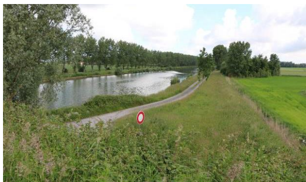
Fig. 2.1 : Dérivation de la Haute Colme, commune de Brouckerque (59630).

Il a été demandé aux exploitants des ILT de chacun des cas de bien vouloir nous transmettre leurs conventions de partenariat, de façon à en comprendre précisément les objectifs et la nature juridique, et à comprendre les règles d'usage négociées entre eux et leurs partenaires de gestion. L'analyse des conventions, reçues durant le printemps, a aussi permis de préparer les visites sur site et les entretiens avec les parties prenantes. Les visites et entretiens se sont déroulés en juin (cas de Dunkerque, Figure 2.1 ), juillet (cas de Digoin et de Boyer, Figures 2.2 et 2.3 ) et août 2018 (cas de Deville, Figure 2.4 ).