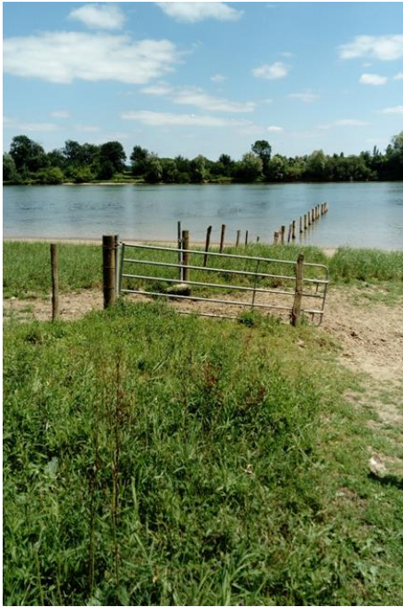
Fig. 2.3 : Clôture et portail sur les berges de la Saône à Boyer (71700).