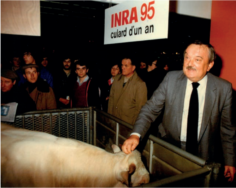
Jacques Poly sur le stand de l'Inra au Salon international de l'agriculture à Paris en 1982. La pancarte « INRA 95 culard d'un an » fait référence à un programme de génétique bovine, développé sur le domaine expérimental de l'Inra à Carmaux.

gouvernement et l'intérêt scientifique indiqué par les chercheurs » 218 , remarque Emmanuel Salmon-Legagneur (1929-2014), nommé directeur du Service des relations internationales en 1979. Une exception notable doit être signalée : la coopération scientifique avec la Chine autour d'un programme d'amélioration de la prolificité des truies par croisement des souches habituellement exploitées en France (Large White et Landrace) avec des souches chinoises hyper-prolifiques. Avec l'arrivée à l'Inra des premiers porcs chinois en 1979, « nous étions alors en mesure de développer l'un des volets de notre stratégie visant à doter les éleveurs porcins français d'un matériel génétique atteignant des performances élevées en matière de prolificité » 219 , se souvient Christian Legault (1937-). Jacques Poly en revanche poursuit une pratique héritée de ses prédécesseurs avec l'objectif de faire connaître les travaux de l'Inra : il organise des visites de sites Inra (et particulièrement de Jouy-en-Josas) pour des responsables agricoles, politiques, et autres dignitaires venant de différents pays. Jacques Poly se plaît ainsi à montrer l'Inra comme une double vitrine : celle de la modernisation de l'agriculture et de la science agronomique françaises.