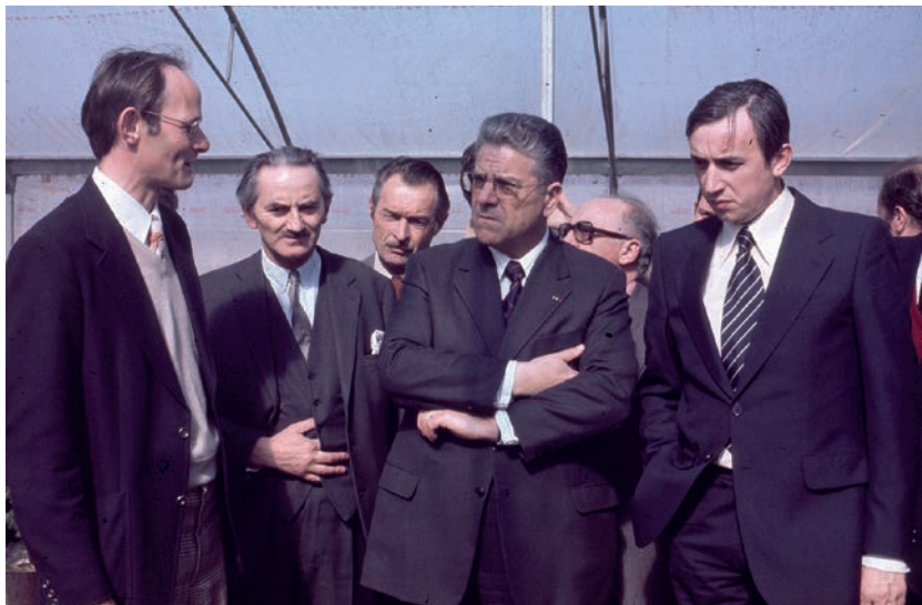
Pierre Méhaignerie, ministre de l'Agriculture, avec à sa droite Louis Perrin, président du conseil d'administration de l'Inra, et Louis Malassis lors de la Journée de l'arbre, où il inaugure le Centre forestier Inra d'Orléans, en avril 1977.

Né en 1939. Ingénieur agronome (École nationale supérieure d'agronomie de Rennes) et ingénieur du Génie rural, des Eaux et des Forêts. Député à partir de 1973 (Centre des démocrates sociaux, CDS, qu'il présida de 1982 à 1994), réélu sans interruption jusqu'en 2012, circonscription de Vitré (Ille-et-Vilaine). Secrétaire d'État à l'agriculture dans le gouvernement de Jacques Chirac en janvier 1976, puis ministre de l'Agriculture de mars 1977 à mai 1981 dans le gouvernement de Raymond Barre. Ministre de l'Équipement, du Logement et de l'Aménagement du territoire (1986-1988), puis ministre d'État, ministre de la Justice, garde des Sceaux (1993-1995). Plusieurs mandats locaux, notamment maire de Vitré depuis 1977, et président de Vitré Communauté depuis 2002.