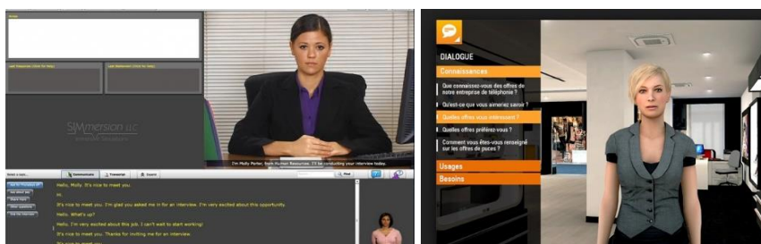
Fig. 1. Choix des réponses dans SIMmersion (gauche) et VTS Editor (droite)

rations que proposent ces simulations ne permettent pas de créer des situations authentiques, porteuses de charges émotionnelles. En effet, ces interactions présentent trois inconvénients majeurs. Premièrement, l'apprenant clique sur des phrases et ne travaille donc pas ses compétences en communication orale. Deuxièmement, les réponses sont prédéfinies et l'apprenant ne travaille donc pas la construction de ses propres phrases. Pour finir, la posture et les expressions faciales de l'apprenant ne sont pas du tout prises en compte par le système.