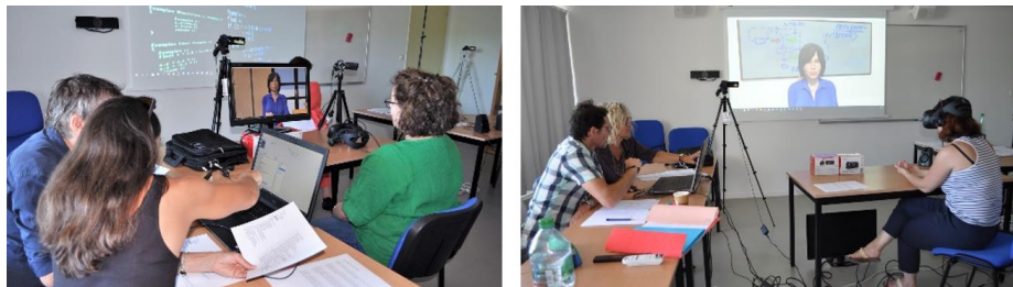
Fig. 4. Expérimentation de TGRIS (deux versions ont été testé : Ecran et Réalité Virtuelle)

TGRIS a été utilisé dans le cadre d'une journée de formation par les pairs en juin 2018 avec 12 CP, dont quatre sont expérimentés. Ces derniers ont souhaité jouer le rôle du formateur et piloter l'ACA par binôme. Afin de réduire la taille du groupe, nous l'avons divisé en deux : le matin, un des groupes faisait des jeux de rôle pendant que l'autre testait TGRIS. Les groupes ont été intervertis l'après-midi. Les CP ont testé deux versions de TGRIS (fig. 4). En effet, afin de repérer si la RV facilite la prise de conscience des émotions (Q3), nous avons développé une version de TGRIS dans laquelle l'ACA est affiché sur un écran. Cette version nous permettait également de filmer l'intégralité du visage des CP, ce qui était primordial pour analyser les émotions ressenties. Nous avons également filmé les séances de débriefing qui avaient lieu après chaque simulation d'entretien (jeu de rôle, TGRIS RV ou TGRIS écran).