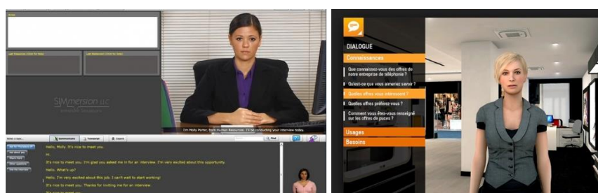
Fig. 1. Choix des réponses dans SIMmersion (gauche) et VTS Editor (droite)

rations que proposent ces simulations ne permettent pas de créer des situations authentiques, porteuses de charges émotionnelles. En effet, ces interactions présentent trois inconvénients majeurs. Premièrement, l'apprenant clique sur des phrases et ne travaille donc pas ses compétences en communication orale. Deuxièmement, les réponses sont prédéfinies et l'apprenant ne travaille donc pas la construction de ses propres phrases. Pour finir, la posture et les expressions faciales de l'apprenant ne sont pas du tout prises en compte par le système.