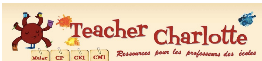
Fig. 2. La bannière du site de Charlotte

Charlotte publie ses ressources sous le seul pseudonyme "Teacher Charlotte" et s'interroge sur l' "image que ça peut renvoyer à l'institution" . Même si elle avoue le caractère limité de tels choix, expliquant qu' "on peut quand même nous démasquer" , l'institution apparaît ici comme une composante transversale dont la crainte est plus ou moins fantasmée. Par ailleurs, bien que la conceptrice cherche à être le moins visible possible pour l'institution, dans l'organisation générale des activités proposées, l'institution est présente.