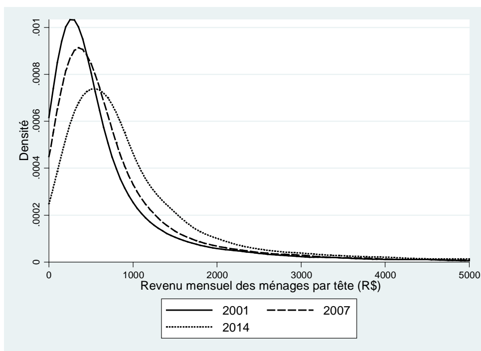
Figure 1 : Distributions du revenu (fonctions de densité kernel ) (Brésil, 2001, 2007 et 2014)